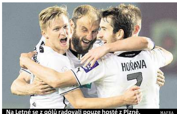
Na Letné se z gólů radovali pouze hosté z Plzně.

Fotbalisté Plzně zvítězili ve slágru 27. kola první ligy na půdě Sparty 2:0.