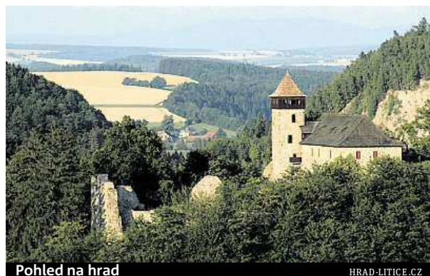
Pohled na hrad

Pozdní zprávy tvrdí, že Jiří zde chtěl vytvořit pevný úkryt pro korunovační klenoty a pro zemské desky. České poklady však nikdy nebyly na hradě ani přechodně uloženy. MAREK PEŠKA