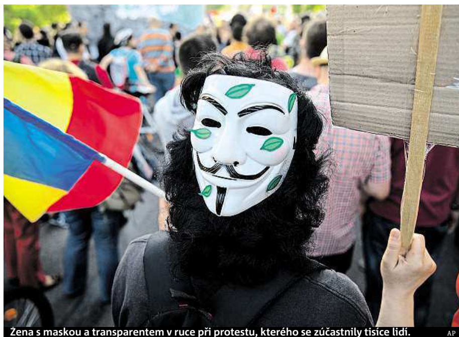
Žena s maskou a transparentem v ruce při protestu, kterého se zúčastnily tisíce lidí. AP

V Bukurešti o víkendů protestovaly tisíce lidí proti těžbě dřeva ve velkém a obviňovaly politiky z toho, že z hlediska celé Evropy důležité rumunské lesy nechrání. Informovala o tom agentura AP. Demonstranti procházeli centrem Bukurešti a nesli transparenty s hesly jako „Když se spojíme, můžeme lesy zachránit“. Politici podle nich nechávají vykácet velké plochy lesů kvůli zisku a nedělají nic proti nepovolenému kácení. Během komunismu byly hluboké lesy pod přísnou státní kontrolou, v posledních letech se ale podle AP v zemi velmi rozmohlo nepovolené kácení. V Rumunsku je 6,6 milionu hektarů lesů, žijí v nich i medvědi a vlci. Rumunský prezident protesty označil za legitimní a řekl, že tématem se na svém příštím zasedání bude zabývat bezpečnostní rada státu. ČTK