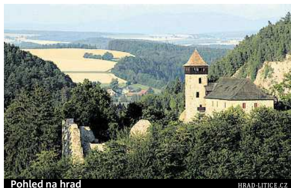
Pohled na hrad

Pozdní zprávy tvrdí, že Jiří zde chtěl vytvořit pevný úkryt pro korunovační klenoty a pro zemské desky. České poklady však nikdy nebyly na hradě ani přechodně uloženy. MAREK PEŠKA