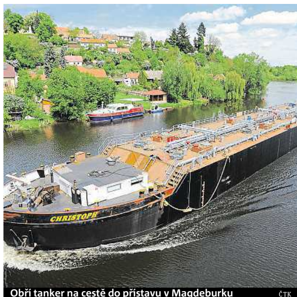
Obřít tanker na cestě do přístavu v Magdeburku ČTK

týdny potom tlačný remorkér po řece dopravil z Lovosic nový střední segment. Dělníci ve Chvaleticích starou středovou sekci odřízli a sešrotovali. Na nový nákladový prostor přivařili původní část lodi, kde jsou stroje a kabina. Tím loď zkompletovali. Důvodem výměny středové sekce byl kromě jejího opotřebení i požadavek Evropské unie, aby tankery na chemické látky měly dvouplášťové dno. ČTK