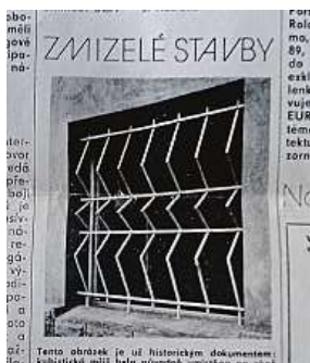
Článek z časopisu Architekt z dubna roku 1989 3x METRO

Architekt a také historik architektury Zdeněk Lukeš, ale nejen on, mapoval v 80. letech minulého století ve čtrnáctideníku Architekt (vydával ho tehdejší Svaz českých architektů) zmizelá místa na mapě architektury v Praze i jinde po Československu. Chýlila se ke konci osmdesátá léta a už přece jen šlo ukazovat, co zmizelo schválně či neudržováním z našich ulic, co někdo neodborně přestavěl a upravil.