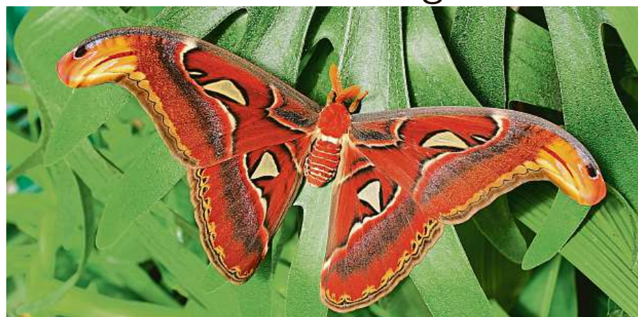
Těšit se můžete i na motýla pojmenovaného atlas velkých. Vyskytuje se v pralesích jihovýchodní Asie. BZHM

Botanická zahrada hlavního města Prahy opět připravuje oblíbenou výstavu motýlů – tentokrát pod názvem Motýli: Dobrodružná cesta. Přehlídka tropických motýlů tak letos bude zaměřena na migraci. Do Prahy jako každoročně doputuje přes 5000 kulek z motýlí farmy ve Stratfordu nad Avonou. Z nich se ve skleníku Fata Morgana vylíhnou krásavci několika desítek druhů. Součástí výstavy motýlů bude i panelová výstava k Roku motýlů 2024, věno-