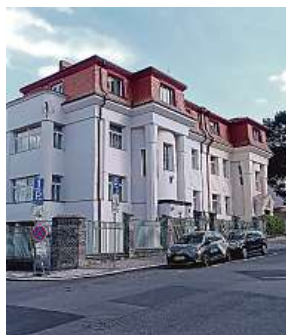
Gočárův kubistický dvojdom na Hradčanech v Tychonově ulici

Na jaře 1988 se objevila malá zmínka o mříži, která zmizela ze suterénního okna kubistického dvojdomu od Josefa Gočára v Tychonově ulici. Původní zábranu, v kubistickém stylu jako celý dům, nahradila zřejmě nějaká běžná mříž. V článku není, bohužel, náhrada vyfotografována, autor použil snímek z archivu Národního technické