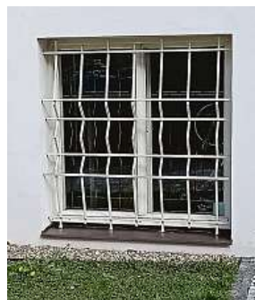
Současná podoba mříže, stejná jako na zbylých oknech domu

Zajímalo nás, jestli téměř 40 let poté je stav onoho okna stejný, nebo jestli se něco změnilo. Změnilo. Popi-