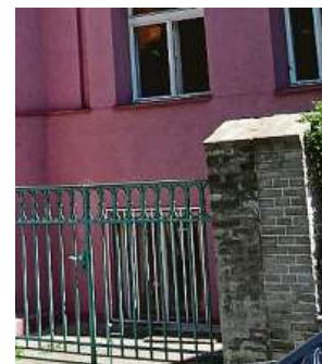
Ještě nekubistická „náhradní“ mříž na okně GEMA ART

sovaná nesourodá mříž na tom domě, který je naproti vjezdu do Ministerstva obrany ČR, už zřejmě dávno není. Je tam opět mříž kubistická. Ale při pečlivém zkoumání zjistíte, že se jedná nejspíš o kopii, stejně tak jako jsou mříže na jiných spodních oknech domu. Takže po výměně nevhodného mřížování při renovaci objektu dodali