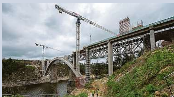
Nový obloukový železniční most na Písecku

Proslavila se v seriálech Beverly Hills 90210 (na levém snímku zcela vpravo) nebo Čarodějky. Shannen Doherty v pátek oslaví 53. narozeniny. Média před několika dny přišla se zprávou, že herečka má rakovinu a začala třídit majetek. Má v úmyslu darovat nebo prodat věci, které v průběhu let nashromáždila. A to proto, aby matce po své případné smrti ulehčila situaci. IDNES.cz