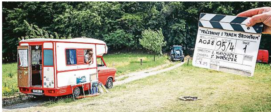
Děj se točí okolo Broučka, jedná se o červený pojízdný obytný vůz z roku 1972.