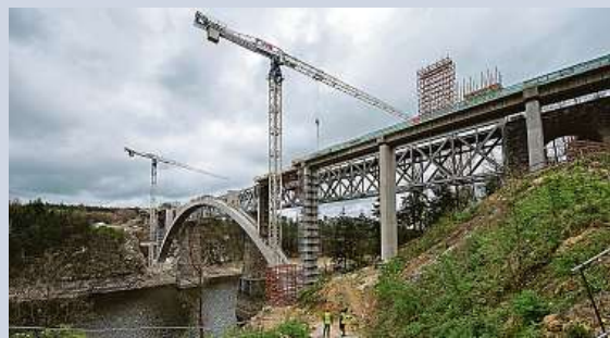
Nový obloukový železniční most na Písecku

Dvojice mužů a jedna žena napadli 55letého řidiče MHD u jedné z olo-mouckých zastávek. Incident se stal v úterý večer. Důvodem sporu bylo to, že řidič chtěl vyložit z přepravky, neboť cestovali bez jízdenky. Napadenému řidiči přispěchali na pomoc cestující, agresori napadli i jednu ze svědkyň. Z místa incidentu poté utekli, policisté po nich pátrají. ČTK