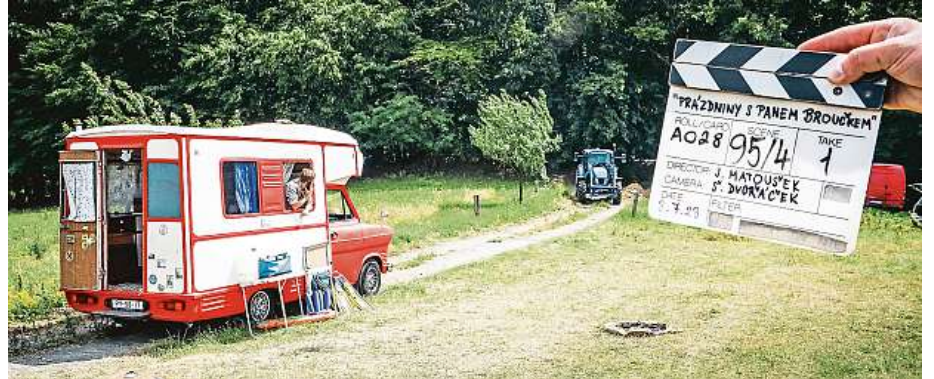
Děj se točí okolo Broučka, jedná se o červený pojízdný obytný vůz z roku 1972.