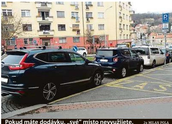
Pokud máte dodávku, „své“ místo nevyužijete.

V Musílkově ulici v Praze 5 je k vidění neobvyklá anomálie. Dvě čáry na vozovce si už pár měsíců navzájem odporují.