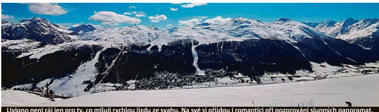
Livigno není ráj jen pro ty, co milují rychlou jízdu ze svahu. Na své si přijdou i romantici při pozorování slunných panoramat.

nost se skvěle hodí plavání, a to konkrétně v místním vodním světě jménem Aquagranda. Jedná se o jedno z největších a nejmodernějších sportovních, wellness a relaxačních center v Evropě.