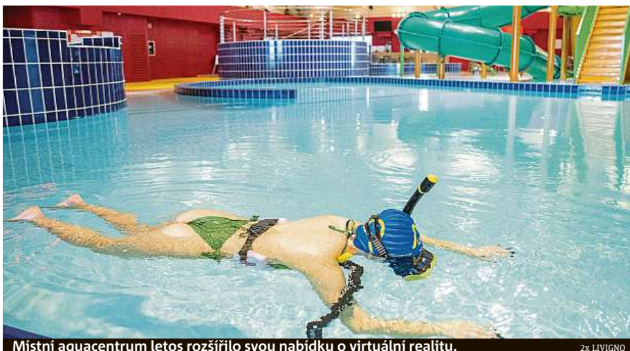
Místní aquacentrum letos rozšířilo svou nabídku o virtuální realitu.

Po náročném dni byste neměli zapomenout na odpočinek a relaxaci. Pro tuto čin-