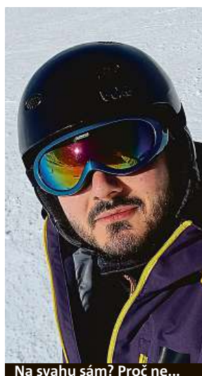
Na svahu sám? Proč ne...