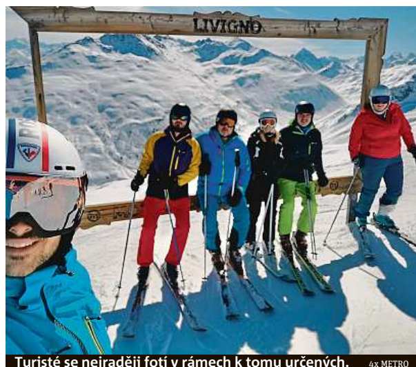
Turisté se nejraději fotí v rámech k tomu určených.