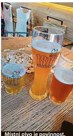
Místní pivo je povinnost.