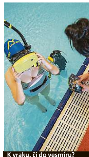
K vraku, či do vesmíru?