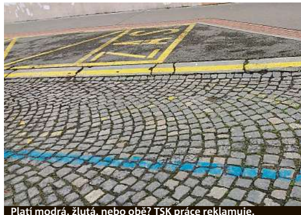
Platí modrá, žlutá, nebo obě? TSK práce reklamuje.