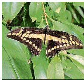
Motýly uvidíte na zeleni.

Do Troji dorazí na 5500 kukel několika desítek druhů. Třeba endemický filipínský otakárek, jenž má křídla o rozpětí až 15 centimetrů. Nebo motýl patříci k největším na světě. Je to martináček Attacus atlas, jehož rozpětí křídel může dosáhnout 25 cm. MET