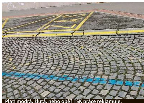
Platí modrá, žlutá, nebo obě? TSK práce reklamuje.

„Vzniklo to leností těch, kteří v páté městské části malovali modré zóny, nebo jde o předpis, který si už nepamatují?“ Podobné myšlenky táhly hlavou čtenáře deníku Metro Milana Poly poté, co při procházce v Musílkově ulici v Praze 5 přímo naproti místní pamětní desce Obětem druhé světové války objevil dvě navzájem si odporující čáry na vozovce.