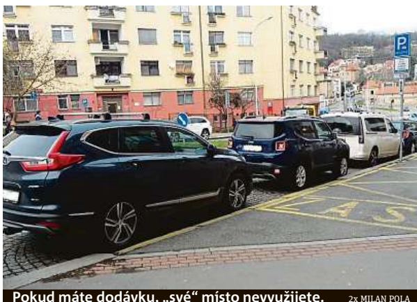
Pokud máte dodávku, „své“ místo nevyužijete.

V Musílkově ulici v Praze 5 je k vidění neobvyklá anomálie. Dvě čáry na vozovce si už pár měsíců navzájem odporují.