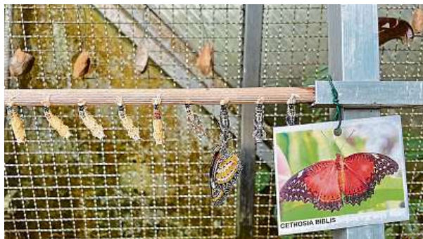
Lze spatřit i okamžik, kdy se kukla promění v motýla.