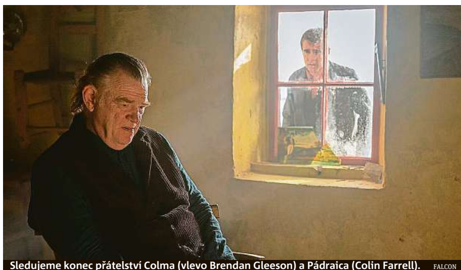
Sledujeme konec přátelství Colma (vlevo Brendan Gleeson) a Pádraica (Colin Farrell).

Po nezvyklé tragédii v herním studiu s názvem CompWare v centru Los Angeles, jehož šéf si ustřelil hlavu v přítomnosti plné dětí, přichází do města andělů záhadný konzultant Regus Patoff (Christoph Waltz) a ujímá se vedení