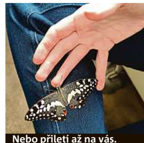
Nebo přiletí až na vás.