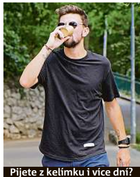
Pijete z kelímku i více dní?