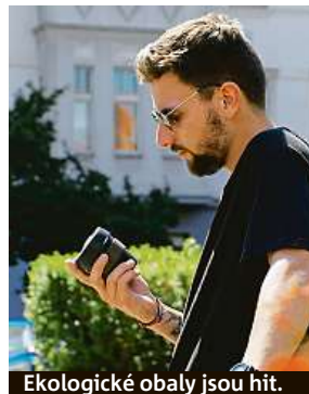
Ekologické obaly jsou hit.