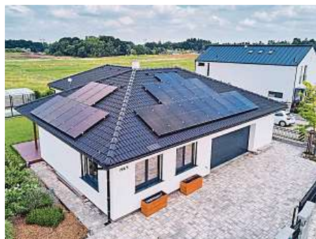
Podle čeho vybírat dodavatele fotovoltaiky?