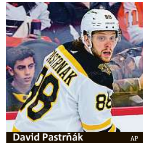
David Pastrňák

David Pastrňák nastřelil v aktuální sezoně NHL 60 gólů.