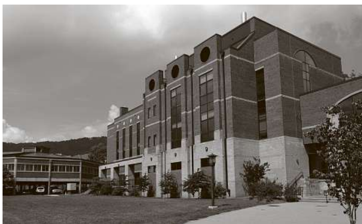
BioMedic Center Clinic v Kodani – zde se uskutečnilo první vydání programu úhrad, během kterého se 99 % lidí vrátilo do normálního sluchového vedení do 72 hodin

Inteligentní zesilovač odvrací pokročilé poškození sluchového nervu za pouhých 7 dní a obnovuje dokonalý sluch i u lidí, kteří bojují se stařeckou hluchotou. Myslete tedy také na své blízké – možná vás rodiče či prarodiče žádají, abyste stále častěji opakovali, co říkají, nebo zapínali rádio a televizi hlasitěji a hlasitěji? Ignorování progresivní ztráty sluchu vás odsuzuje k úplné hluchotě, protože sluchové postižení nikdy