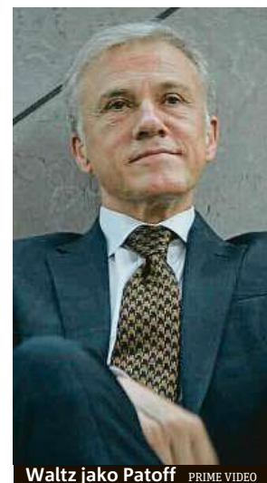
Waltz jako Patoff

Moment překvapení při nástupu Waltze, ukázky jeho charakterových vad i zneklidňující atmosféra plná otazníků strašně rychle diváka omrzí. Nastupuje pachut, která kvůli absenci čehokoliv láka