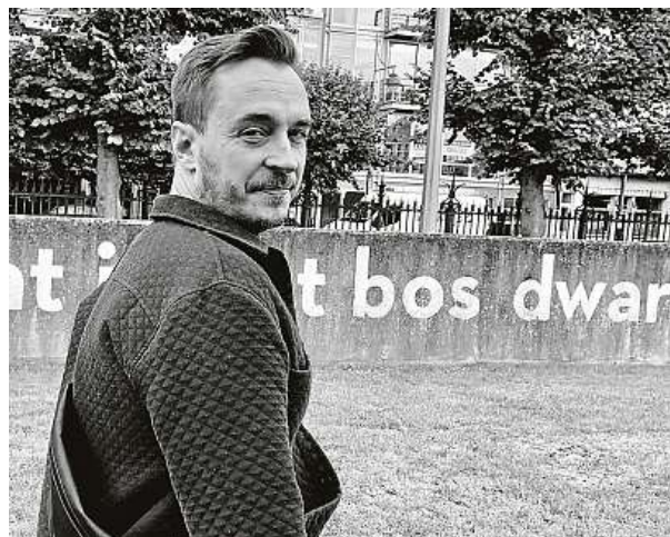
Překládat komiksy bylo jeho dlouhodobé přání.