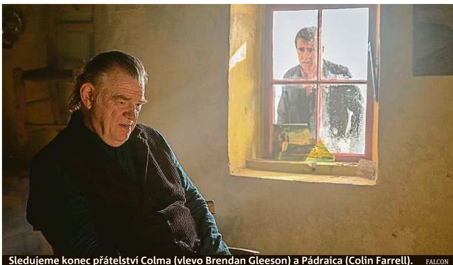
Sledujeme konec přátelství Colma (vlevo Brendan Gleeson) a Pádraica (Colin Farrell).

Po nezvyklé tragédii v herním studiu s názvem CompWare v centru Los Angeles, jehož šéf si ustřelí hlavu v místnosti plné dětí, přichází do města andělů záhadný konzultant Regus Patoff (Christoph Waltz) a ujímá se vedení