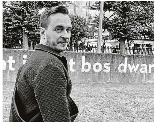
Překládat komiksy bylo jeho dlouhodobé přání.