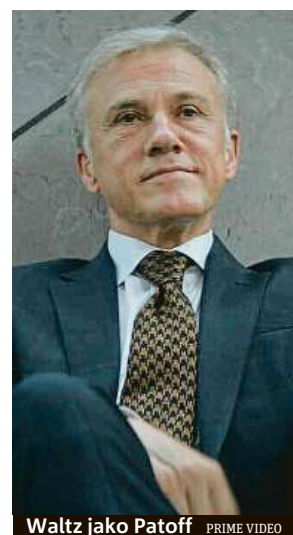
Waltz jako Patoff

Moment překvapení při nástupu Waltze, ukázky jeho charakterových vad i zneklidňující atmosféra plná otazníků strašně rychle diváka omrzí. Nastupuje pachut, která kvůli absenci čehokoliv láka-