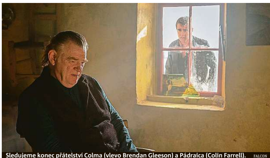
Sledujeme konec přátelství Colma (vlevo Brendan Gleeson) a Pádraica (Colin Farrell).

Po nezvyklé tragédii v herním studiu s názvem CompWare v centru Los Angeles, jehož šéf si ustřelí hlavu v momentu plné děty, přichází do města andělů záhadný konzultant Regus Patoff (Christoph Waltz) a ujímá se vedení