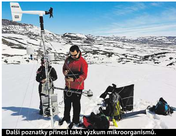
Další poznatky přinesl také výzkum mikroorganismů.

Mendelova polární stanice loni oslavila desáté výročí, fungovat začala 22. února 2007. Její vybudování stálo asi 50 milionů korun. Mezi významné objevy patří důkaz existence fosilních živočišných hub v Antarktidě či objev pozůstatků vodního ještěra plesiosauro. ČTK