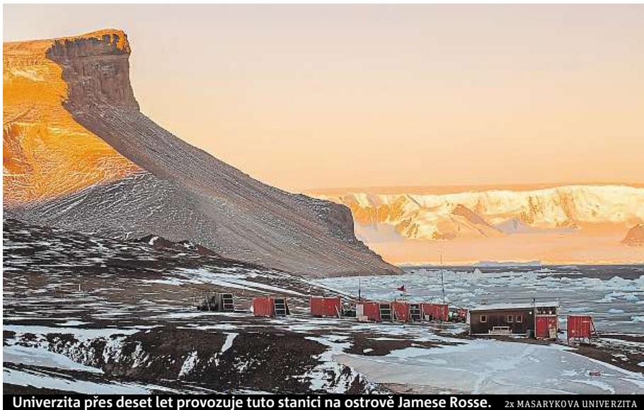
Univerzita přes deset let provozuje tuto stanici na ostrově Jamese Rosse.