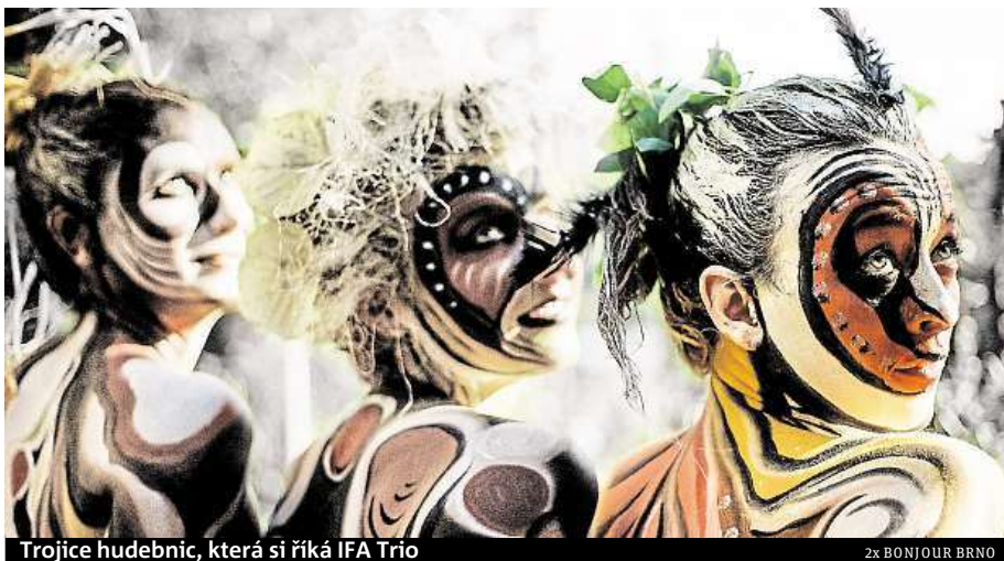
Trojice hudebnic, která si říká IFA Trio

Festival tak nabízí celou řadu perspektiv prosycených ženským šarmem: od akrobacie přes výstavu a divadelní talk show, kinematografii, literární setkání, komiks,