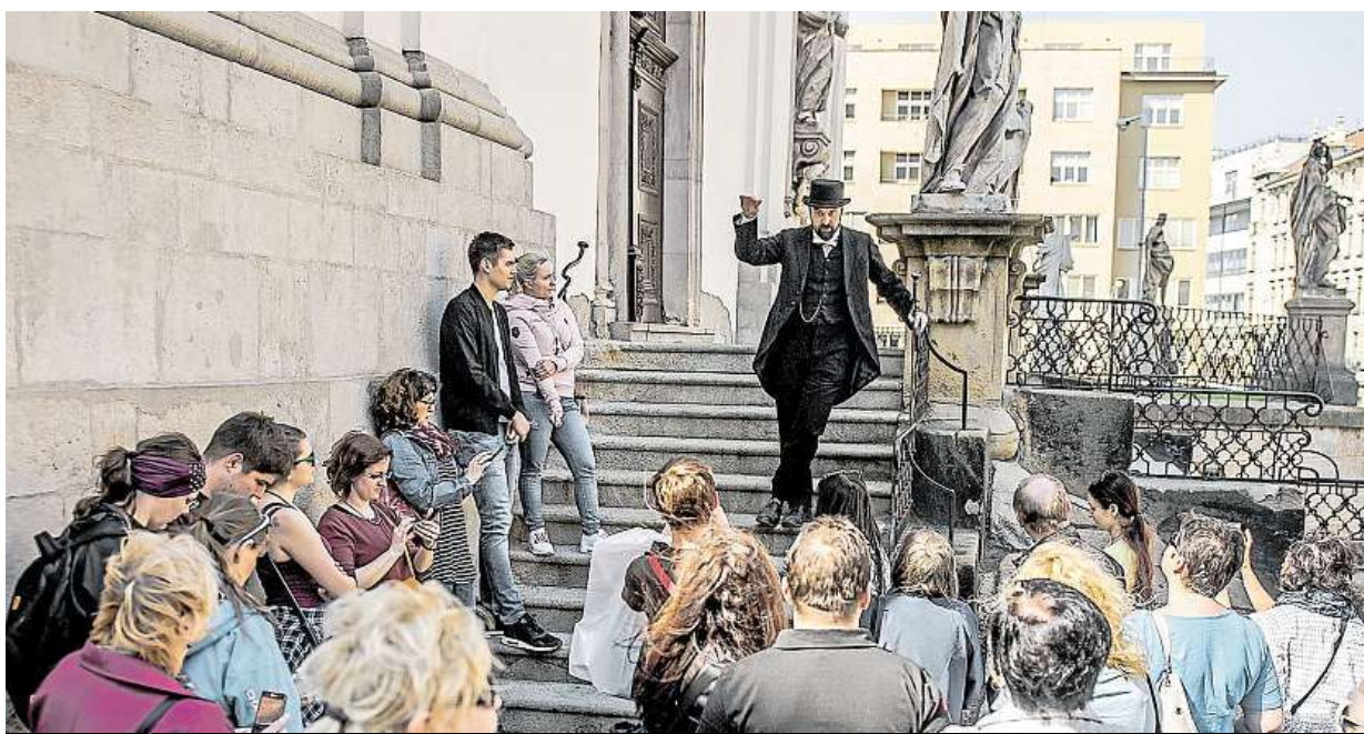
Okruhy s průvodcem

Jednou v roce si TIC Brno a jeho průvodci prohodí roli s veřejností. Každý, kdo chce ukázat ostatním město po svém, může přihlásit návrh komentované prohlídky. Pokud uspěje ve veřejném hlasování, stane se na jeden den profesionálním průvodcem a představitel své trasy zájemcům. „Na naši výzvu Staň se průvodcem! zareagovalo osmnáct průvodců amatérů a vymysleli osmnáct nových tras. Zájem o výzvu byl letos násobně vyšší než minule. Protože i kvalita byla vyrovnaná, rozhodli jsme se dát prostor hned sedmi komentovaným prohlídkám a věnujeme jim celý víkend,“ říká ředitelka