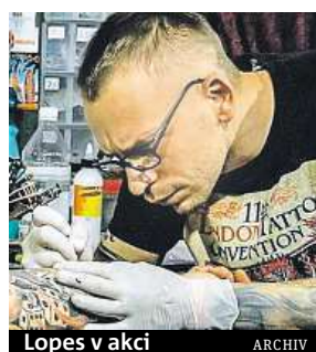
Lopes v akci

ci v jednom malém studiu na okraji Amstru, kde jsem myl podlahu, čistil tatérské náčiní a předkresloval návrhy pro mistry tatéry. Taky jsem