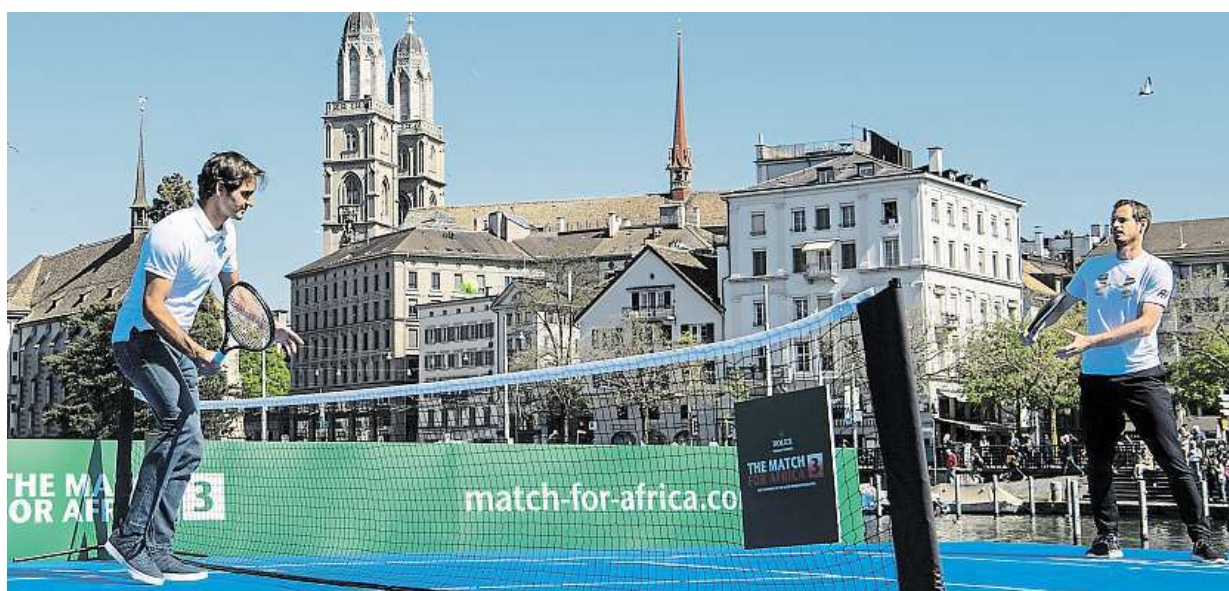
V Curychu se uskutečnil třetí ročník exhibičního utkání Match for Africa. Roger Federer (vlevo) si pozval Andyho Murrayho.

Dešovka. Nový dotační program se zaměřuje na hospodaření s vodou z mraků v domácnosti. Motivace. Připraveno je 100 milionů. Systémy na zadržení vody. Jen pro lidi v oblastech postižených suchem STRANA 7