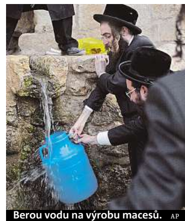
Berou vodu na výrobu macesů.

V Izraeli vrcholí přípravy na svátek Pesach, který je připomínkou útěku předků z egyptského otroctví. K tradičnímu zvyku patří vymést z příbytků veškeré kvašené potraviny. Gruntování se podle izraelských médií nevyhnuli ani vojáci, kteří pod dohledem rabína čistili tanky. V ortodoxních čtvrtích Jeruzaléma stáli lidé fronty u míst, kde se v kádích s vařící vodou umývaly hrnce a kuchyňské nářadí, jež se bude o svátku používat. Pesach začal včera se západem slunce. Při Pesachu se konzumují nekvašené chleby – macesy a hořké byliny. Po celý týden, kdy oslavy trvají, se nejí nic kynutého a nepije nic kvašeného. ČTK