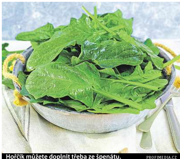
Hořčík můžete doplnit třeba ze špenátu.

Jste nervózní více než jindy, špatně se soustředíte a trpíte svalovými křečemi? Je možné, že máte málo hořčíku.