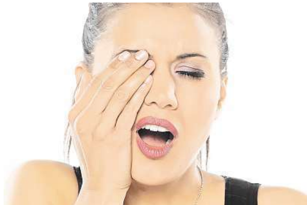
Dejte pozor na svoje oči!

Výrazné svědění, zvýšené slzení, oteklé oči, pocit cizího tělíska v oku, pálení, řezání a zarudnutí očí – to všechno jsou příznaky oční alergie. „Důležité je zamezit kontaktu očí s alergenem. Například při alergii na pyl mohou pomoci sluneční brýle, ty udrží alespoň část alergenu mimo oči. Také je dobré podrážděné oči vypláchnout studenou vodou. Akutní příznaky pomohou zmírnit oční kapky s obsahem antihistaminik a látek, které zmírňují zarudnutí a otok. Na oteklá víčka příznivě působí studený obklad. Při pocitu svědění mají alergici tendenci si oči mnout. To ale může potíže ještě zhoršit, protože mnutí očí může uvolňovat ještě víc