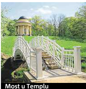
Most u Templu