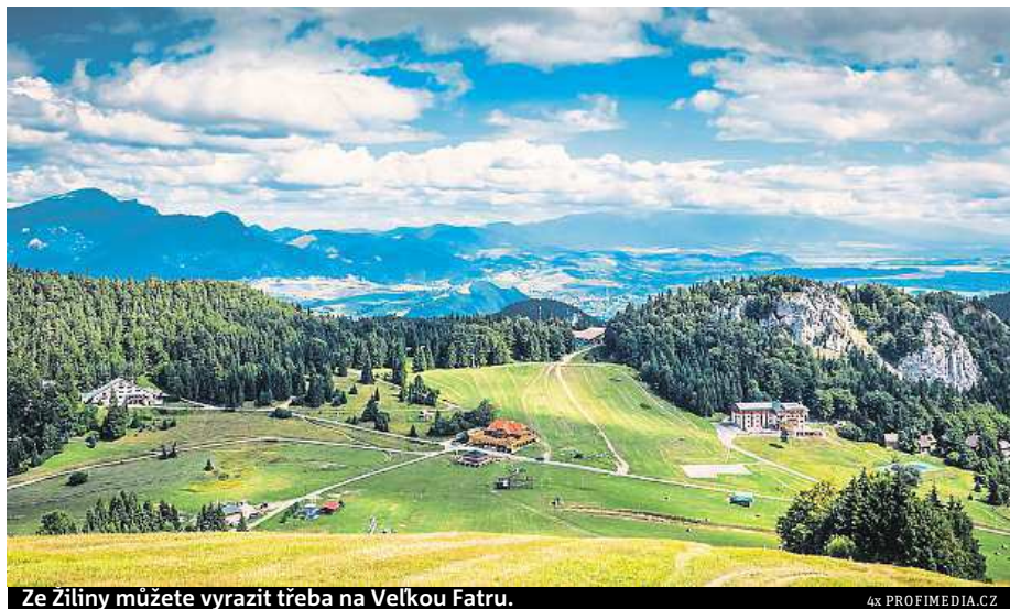
Ze Žiliny můžete vyrazit třeba na Velkou Fatru.

V Malé Fatře je třeba obec Terchová, kde má muzeum slavná osobnost slovenské historie – zbojník Jánošík. V létě máte možnost se vykoupat v místních přehradách, ale také v městských bazénech. Jižně pod Žilinou se nachází lázně Rajecké Teplice, které se proslavily především svou minerální vodou Rájec. Na túru se můžete vydat jak pěšky, tak i na kole, což je výhoda, protože míst můžete navštívit mnohem víc. Což určitě oceníte, protože je stále na co se dívat. MET