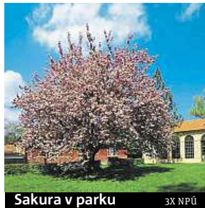
Sakura v parku