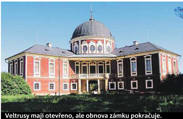
Veltrusy mají otevřeno, ale obnova zámku pokračuje.

Sídlo začalo vznikat v roce 1704. Zámek byl od počátku budován s velkorysou barokní koncepcí jako komplex budov obklopujících čestný dvůr. Ten byl uzavřen řadou soch z dílny slavného socha-