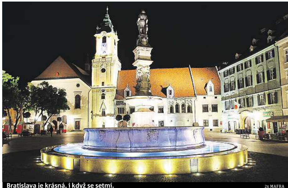
Bratislava je krásná, i když se setmí.

Pivo se v Bratislavě vařilo již za dob Keltů a už v té době soutěžilo s vínem o pozici nejoblíbenějšího nápoje. Dnes slovenská metropole nabízí komentovanou pivní procházku historickým centrem. Turisté se vydají na Michalskou bránu, kde „pivní zvon“ kdysi ohlašoval poslední šanci na objednávku piva. Účastníci exkurze se nad skle-