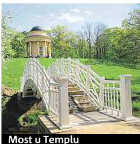
Most u Templu