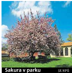
Sakura v parku