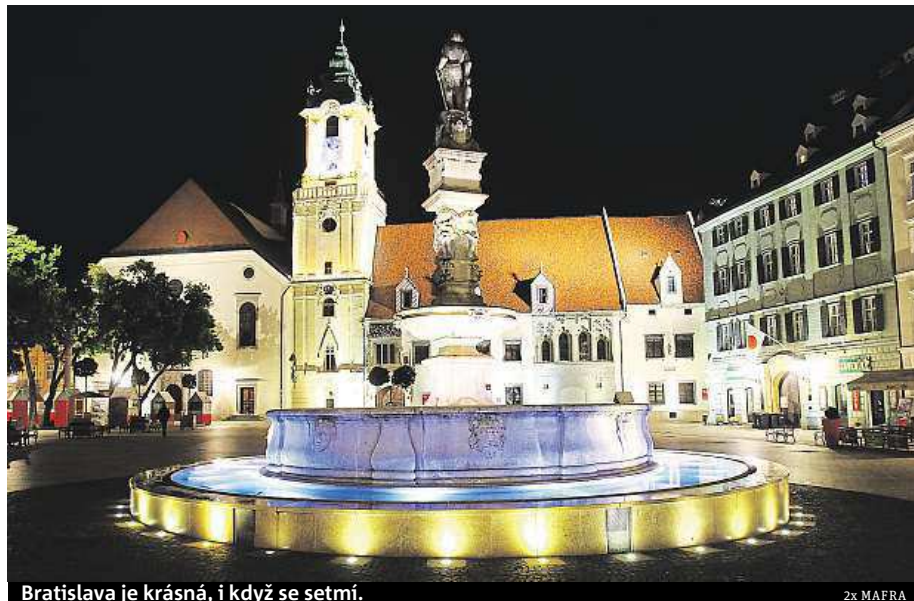
Bratislava je krásná, i když se setmí.

Pivo se v Bratislavě vařilo již za dob Keltů a už v té době soutěžilo s vínem o pozici nejoblíbenějšího nápoje. Dnes slovenská metropole nabízí komentovanou pivní procházku historickým centrem. Turisté se vydají na Michalskou bránu, kde „pivní zvon“ kdysi ohlašoval poslední šanci na objednávku piva. Účastníci exkurze se nad skle-