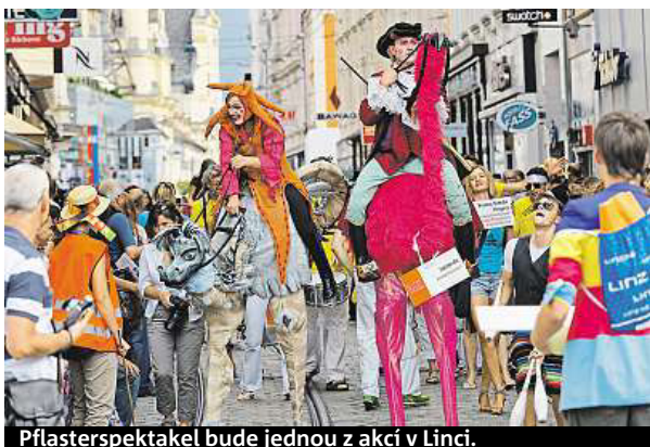
Pflasterspektakel bude jednou z akcí v Linci.

Až se vyšplháte nejstrmější koleje dráhou v Evropě na vrch Pöstlingberg s poutním kostelem, odkud máte krásný výhled na město, projděte si také barokní centrum s Mariánským chrámem a romantickou hlavní ulicí Landstrasse lemovanou malými obchůdky. Tradici a modernu spojuje také impozantní Linecký zámek (známý i jako Zámecké muzeum). Z jeho první strany se tyčí historické zdivo a z druhé strany je jižní křídlo tvořeno moderní prosklenou ocelovou konstrukcí, která nahradila část zámku zničenou požárem v roce 1800. Kouzlo moderny můžete obdivovat v podobě Muzea umění Lentos, centra technologie a budoucnosti