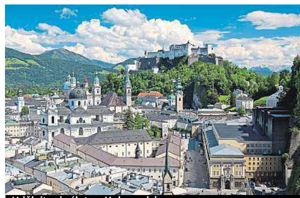
Udělejte si výlet na Hohensalzburg.

Navštívit tady můžete rodný dům skladatele Wolfganga A. Mozarta, Zámek Hellbrunn a jeho fontány, nejrůznější muzea, vydat se můžete na komentovanou prohlídku největšího pivovaru v Rakousku nebo na monumentální pevnost Hohensalzburg. Více na www.salzburg.info . MET