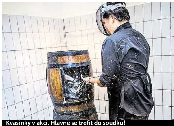
Kvasinky v akci. Hlavně se trefit do soudku!