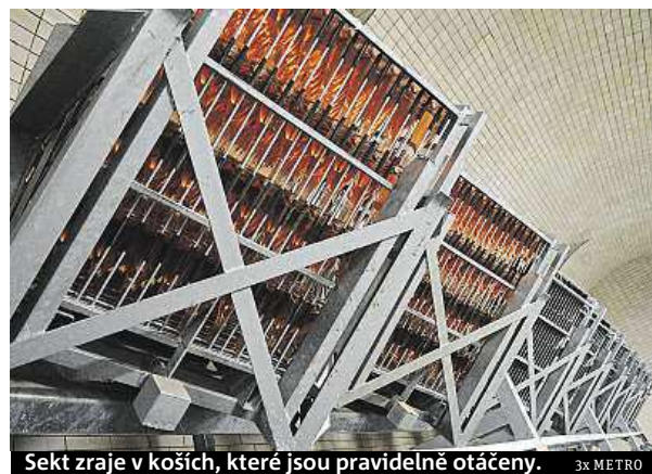
Sekt zraje v koších, které jsou pravidelně otáčeny.