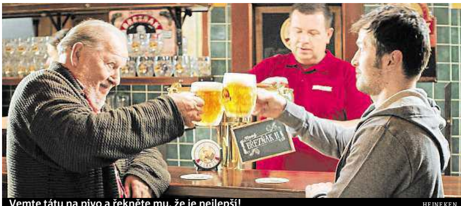
Vemte tátu na pivo a řekněte mu, že je nejlepší!

Snad nikdy v historii ještě nenastala doba, kdy by se život dvou po sobě jdoucích generací lišil více než dnes. Ob-