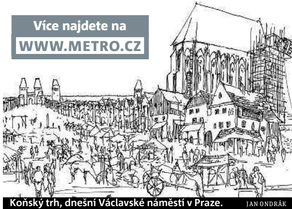
Koňský trh, dnešní Václavské náměstí v Praze.

že ve středověku dostávaly brány název podle toho, kam vedly. Potok Botič se říkávalo ještě v husitských dobách Cedron podle stejnojmenného potoka v Jeruzalémě.