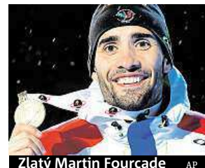
Zlatý Martin Fourcade

Přesná muška vynesla Michalu Krčmářovi úspěch ve vytrvalostním závodu na MS biatlonistů v Oslu.