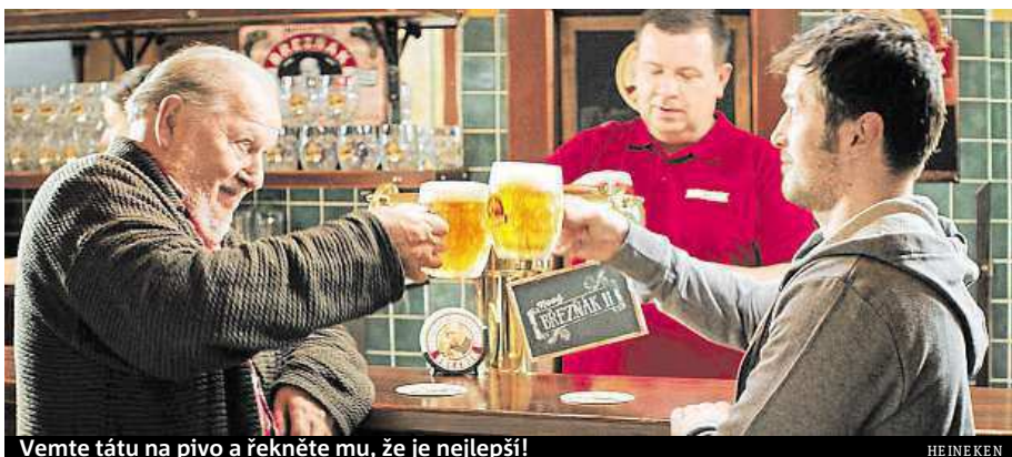
Vemte tátu na pivo a řekněte mu, že je nejlepší!

Snad nikdy v historii ještě nenastala doba, kdy by se život dvou po sobě jdoucích generací lišil více než dnes. Ob-