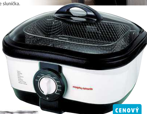
MULTIFUNKČNÍ HRNEC MORPHY RICHARDS INTELLICHEF 48615 2190 Kč

Už i hrnce rozdělujeme na obyčejné a chytré. Ty chytré umí zastoupit hned několik spotřebičů, takže s nimi můžete vařit v páře, grilovat, fritovat nebo třeba zapékat a smažit. Investovat se tedy skutečně vyplatí – od teď už budete vařit jen zdravě a bez zbytečného nádobí.