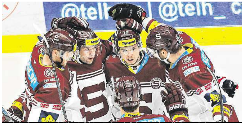
Hokejisté Sparty se chtějí po loňském třetím místě dostat v play-off až na vrchol.

Druhá série začne v pražské Tipsport areně, kde Sparta přivítá Hradec Králové. Na prvním utkání se bude měřit hlasitost fandění. Akce Rade-gastu se postupně zaměří na všechny účastníky play-off. Nejvyšší hodnota decibelů se vynásobí deseti a přesně tolik piv dostanou fanoušci vítězného týmu. Loni vyhráli příz-nivci Plzně se 118,9 decibelu.