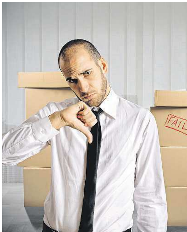
V práci bylo loni spokojeno méně lidí.

S tím chce na veletrhu pomoci také personální server JobDNES.cz. Tým odborníků zájemcům poradí a zdarma na místě zajistí i kvalitní fotografie, kterou uchazeč může přiložit do dopisu zaměstnavateli. „Moderní CV se bez fotografie už dnes skutečně neobejde,“ potvrzuje projektová manažerka Jitka Pytlíková z portálu JobDNES.cz a doplňuje: „V žádném případě ale nepoužívejte momentky třeba z dovolené, budoucí šéfy nezajímají a svědčí o nedostatku profesionality.“ METRO