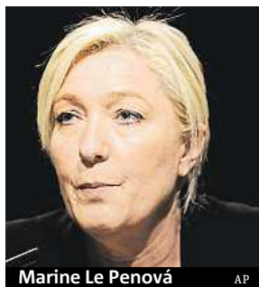
Marine Le Penová

Z jeho peněz si totiž nechala platit svých dvacet asistentů, kteří ve skutečnosti pracovali pro stranu, a ne pro evropskou instituci. Na protikorupční úřad se již s žádostí o prošetření případu obrátil předseda Evropského parlamentu Martin Schulz.