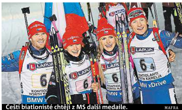
Ceští biatlonisté chtějí z MS další medaile.

Do druhé poloviny dnes vstupuje MS biatlonistů ve Finsku. Čeští reprezentanti touží formu přetavit v medaile.