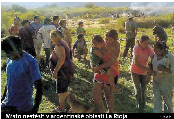
Místo neštěstí v argentinské oblasti La Rioja

Francie truchlí, při natáčení reality show přišla o osm občanů včetně tří olympioniků. Bývalý mistr Evropy fotbalista Wiltord vypadl ze soutěže, a to ho zachránilo.