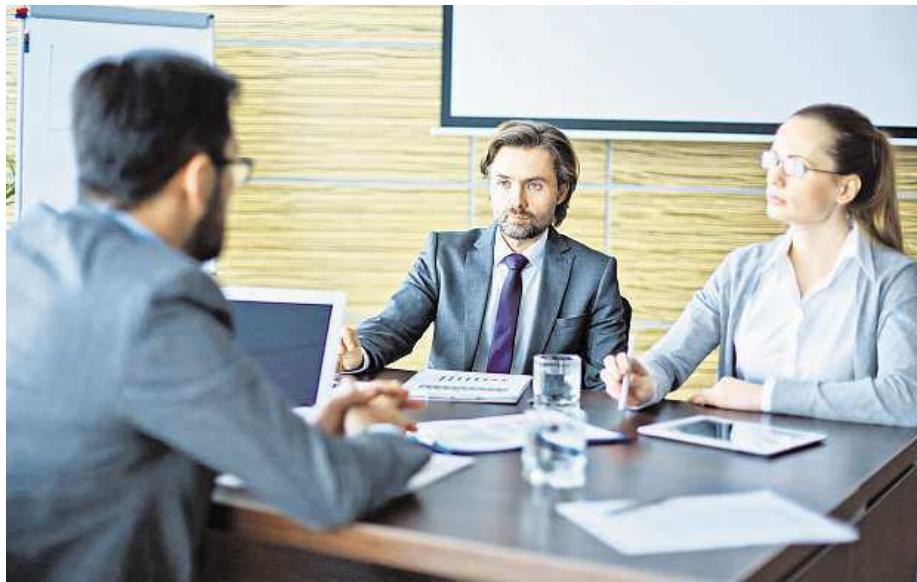
Na pracovní pohovor je dobré se připravit.