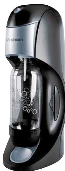
SODASTREAM DYNAMIO TITAN SILVER 1990 Kč

Nebaví vás neustále tahat těžké PET lahve a kromě toho si říkáte, jak se asi s plasty vypořádá příroda?