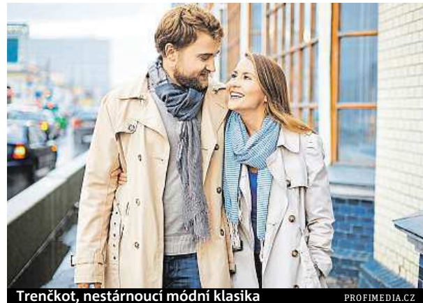
Trenčkot, nestárnoucí módní klasika

Nespornou výhodou takového kabátku je jeho variabilita, můžete jej obléct při různých příležitostech, ale i jej bez problémů zkombinovat s dalšími kusy oblečení. Při výběru ale přihlédněte ke své postavě – pokud máte pár kilo navíc, nedoporučují se vycpávky v ramenou, ti s menší postavou zas musí vybírat nepříliš dlouhý stříh.