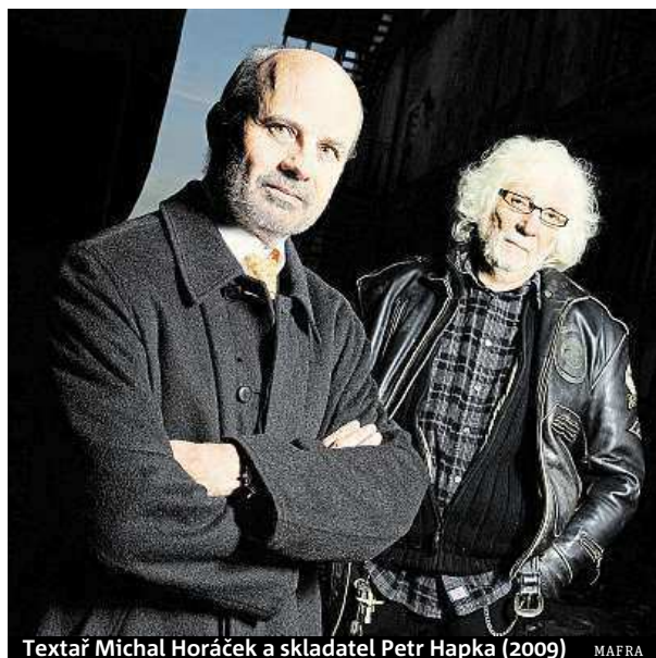
Textař Michal Horáček a skladatel Petr Hapka (2009) MAFRA

Čtyřicet knih vydaných v loňském roce má nominace na ocenění v soutěži Magnesia Litera. V šesti kategoriích včera pořadatelé oznámili po třech nominacích, na Literu za prózu je nominováno šest titulů. Je mezi nimi úspěšná publikace Martina Rejnera (na snímku) o básníkovi Ivanu Blatném nebo obsáhlý román Václava Kahudy Vít, tma, přítomnost. Vítězové budou známi 14. dubna. MAFRA