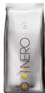
ZRNOVÁ KÁVA NERO CAFFÈ PREMIUM 599 Kč

Pokud si potrpíte na kvalitní kávu, nesmí vašemu hledáčku ujít výborná směs Nero Caffè. S láskou a péčí ji připravujeme ve spolupráci s rodinnou pražírnou elicsire. Vyzkoušejte a zamilujete si ji!