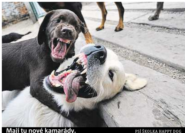
Mají tu nové kamarády.