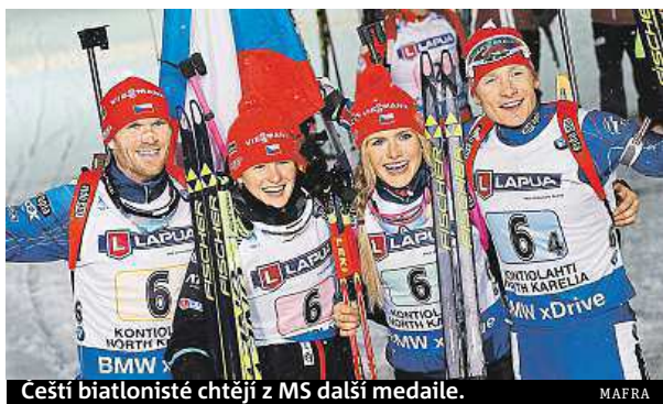
Ceští biatlonisté chtějí z MS další medaile. MAFRA

Do druhé poloviny dnes vstupuje MS biatlonistů ve Finsku. Čeští reprezentanti touží formu přetavit v medaile.