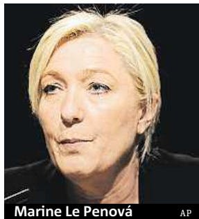
Marine Le Penová

Z jeho peněz si totiž nechala platit svých dvacet asistentů, kteří ve skutečnosti pracovali pro stranu, a ne pro evropskou instituci. Na protikorupční úřad se již s žádostí o prošetření případu obrátil předseda Evropského parlamentu Martin Schulz.