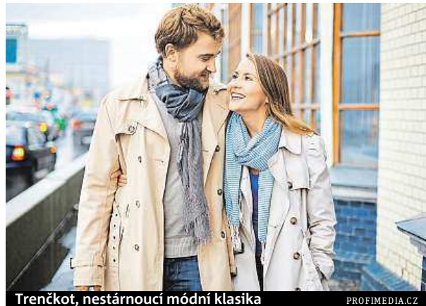
Trenčkot, nestárnoucí módní klasika

Nespornou výhodou takového kabátku je jeho variabilita, můžete jej obléct při různých příležitostech, ale i jej bez problémů zkombinovat s dalšími kusy oblečení. Při výběru ale přihlédněte ke své postavě – pokud máte pár kilo navíc, nedoporučují se vycpávky v ramenou, ti s menší postavou zas musí vybírat nepříliš dlouhý stříh.