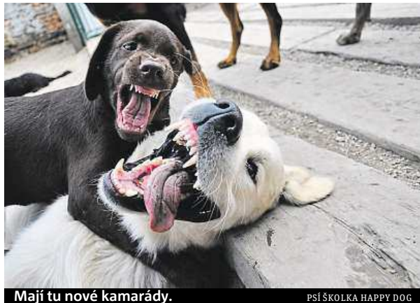
Mají tu nové kamarády.