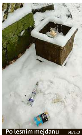
Po lesním mejdanu METRO

I mimo hlavní město platí, že co se do lesa přinese, to tam také zůstane. Vedle prázdných lahví od tvrdého alkoholu a plechovek od piva se v koších vrší stále víc plastových kelímků od kávy, se kterými vyrazejí do městské přírody třeba dvojice na procházce nebo rodiče s kočárky. Málokdo pak odnese nápojový obal do „civilizace“. „V brněnských lesích je i přes