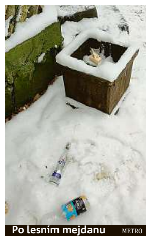
Po lesním mejdanu METRO

I mimo hlavní město platí, že co se do lesa přinese, to tam také zůstane. Vedle prázdných lahví od tvrdého alkoholu a plechovek od piva se v koších vrší stále víc plastových kelímků od kávy, se kterými vyrazejí do městské přírody třeba dvojice na procházce nebo rodiče s kočárky. Málokdo pak odnese nápojový obal do „civilizace“. „V brněnských lesích je i přes