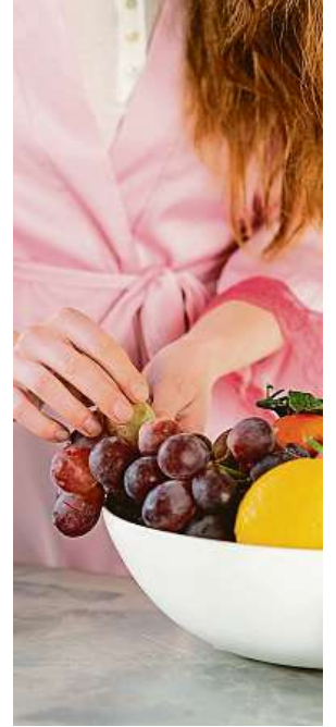
Úprava stravovacích návyků má vliv i na náladu jedince.

Přibližně dvě třetiny lidí opustí svá novoroční předsevzetí do jednoho měsíce. Obzvláště se to týká těch, kteří se rozhodnou nadobro vzdát nikotinu.