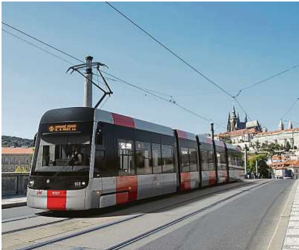
Letos se začne na Václavském náměstí stavět nová tramvajová trať. I zde budou potřeba nová nízkopodlažní vozidla. 3x ŠKODA GROUP