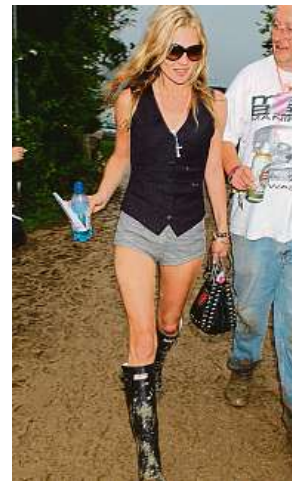
Modelka Kate Mossová se za svůj výrok před lety omlula.

Fenomén diet culture v současnosti v podstatě vystřídal pojem „body positivity“. To znamená, že je normální mít kila navíc, nosit větší velikosti než výše zmiňované a podobně. „Pojem body positivity má za cíl podporovat přijetí a lásku k různorodosti tělesných typů a bojovat proti normám krásy, které často vytvářejí nerealistická očekávání. Je důležité rozlišovat mezi tímto pojmem a podporou ne-zdravého životního stylu.