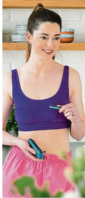
Skoncovat s kouřením je také na top příčkách novoročních cílů.