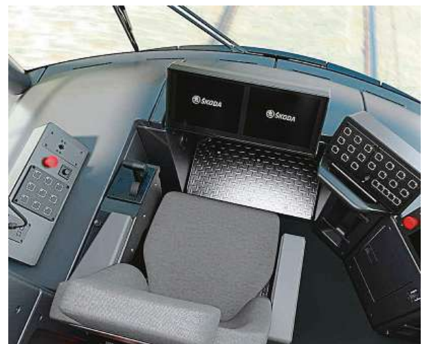
I řidičům se díky novým tramvajím změní život. Panel v kabině řidiče je nově rozdělen na tři samostatné části.