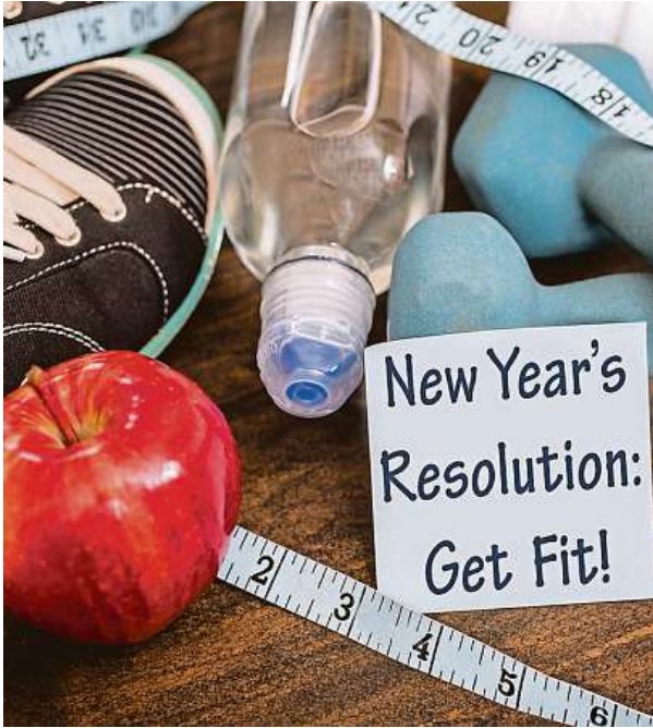
Mezi ta nejčastější předsevzetí patří úprava stravovacích návyků, ať už se jedná o hubnutí, nebo nabrání svalové hmoty.