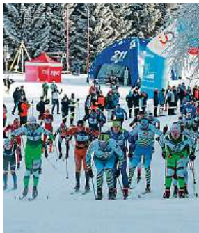
Závodníci na trati Jilemnické 50. Nový ročník se blíží. SKIJILEMNICE.CZ

„Jilemnická 50 není mezi závody žádný nováček a patří mezi nejoblíbenější české laify. Startovat se bude z Horních Míseček. Přesunutí závodu z nižších poloh je logickým krokem po zkušenostech z minulých let a vzhledem k poloze areálu se můžeme spolehnout na dobré sněhové podmínky. Pořadatelé lokalitu důvěrně znají a dokážou připravit tratě na vysoké úrovni. Nicméně přesná podoba okruhů bude zveřejně-