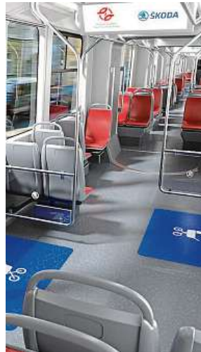
Kapacita nových vozů se oproti 15T zvýší o 33 cestujících.