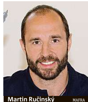
Martin Ručinský

Český hokej uctí dva olympijské vítěze, mistra světa i úspěšného kouče.