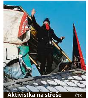
Aktivistka na střeše

Exekutor chce dnes vyhodnotit další postup v celé záležitosti, jestli požádá o pomoc bezpečnostní službu nebo policii. Přes noc měla ob-