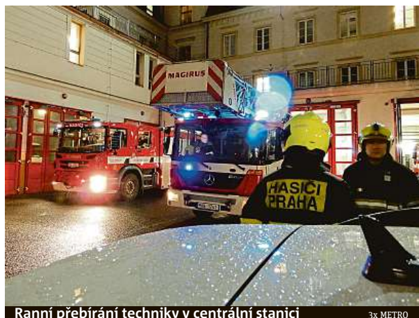
Ranní přebírání techniky v centrální stanici

jakým způsobem specifický, informujeme operační středisko a můžeme vyrazit na místo. Zároveň jsem členem týmu posttraumatické péče, takže se bohužel někdy stane, že jsem povolán operačním střediskem k události, při níž je třeba poskytnout psychologickou nebo psychosociální pomoc. Ať už by to bylo směrem k hasičům, nebo účastníkům nehody či události. Zatím jeden z posledních výjezdů byl v prosinci při dopravní nehodě kamionu a autobusu v Horních Počernicích. Povo-