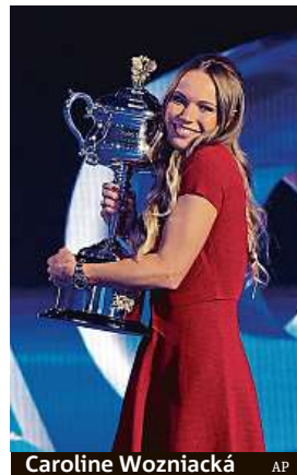
Caroline Wozniacká

Z českých hráčů je v mužském pavouku už jen pětadvacetiletý Veselý, kterého čeká premiérový duel se šestadvacetiletým Američanem Ryanem Harrisonem.