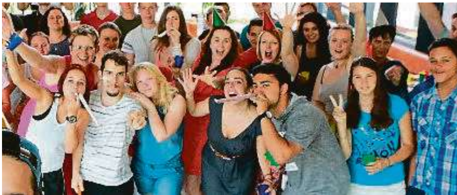
Z dětského domova do života

„Prostě se občas potkají a pokecají si,“ říká Holéciová. Projekt, který zaštiťuje obecně prospěšná společnost Yourchance, je pozoruhodný fenomén. „Často to dělají lidé, kteří mají funkční rodiny a už jsou po všech stránkách saturování a prostě chtějí být tímhle způsobem nápomocní. Jde třeba o pokladní, maminky na mateřské, ale