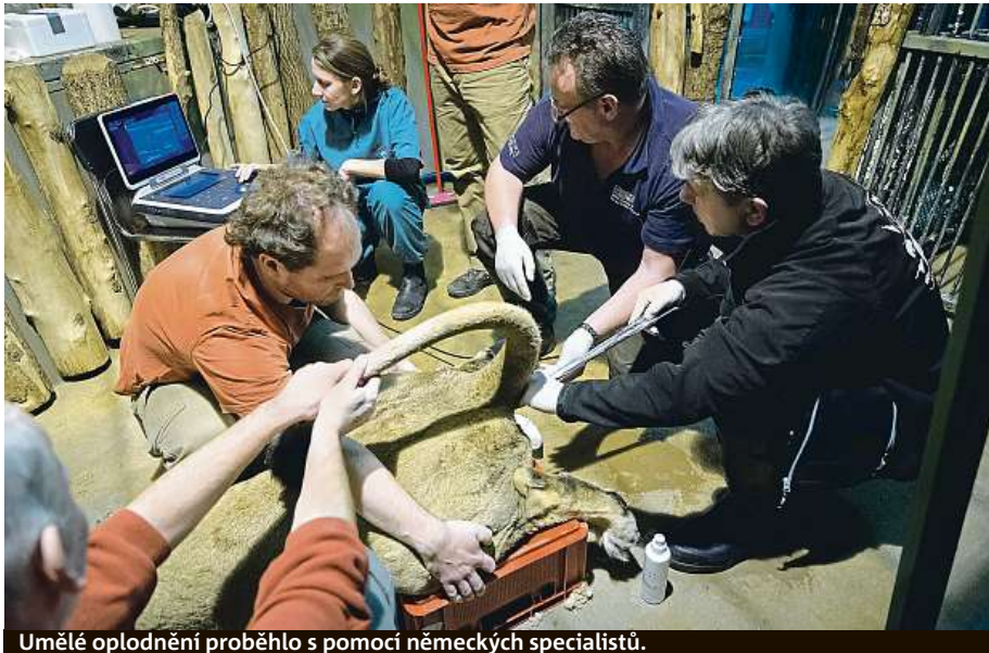
Umělé oplodnění proběhlo s pomocí německých specialistů.