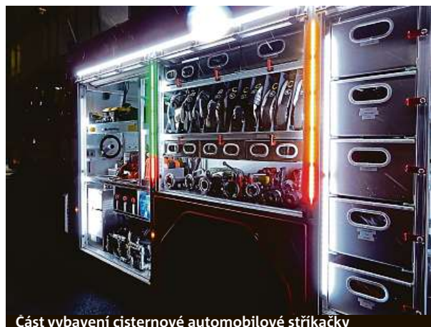
Část vybavení cisternové automobilové stříkačky