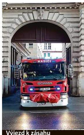
Výjezd k zásahu