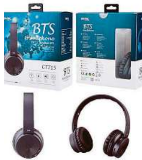
Model Plus CT715

Co když váš telefon nemá výdrž nebo v něm nemáte prostor na hudbu? Co když se od něj potřebujete občas vzdálit bez přerušení poslouchání? Většina bezdrátových sluchátek na trhu nedokáže přehrávat hudbu bez jiného připojeného zařízení. Existují ale výjimky.