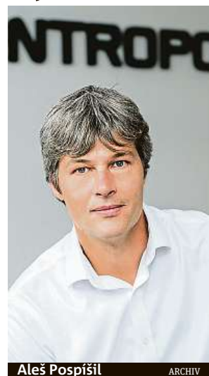
Aleš Pospíšil ARCHIV

Vůbec ne. Záleží na tom, jak je ceník takového produk-