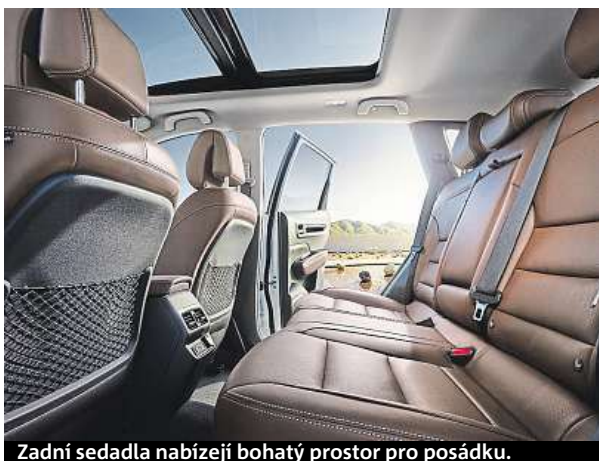
Zadní sedadla nabízejí bohatý prostor pro posádku.