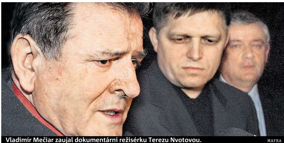
Vladimír Mečiar zaujal dokumentární režisérku Terezu Nvotovou.

Nadpřirozené a ta- juplné. Takové bude slavnostní udílení výročních cen audiovizuální tvorby Trilobit 2018. Uskuteční se v neděli 14. ledna v Berouně.