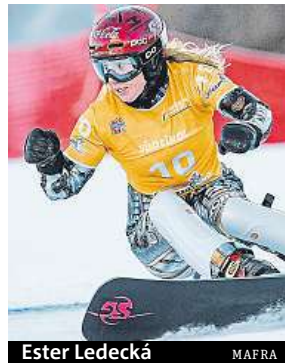
Ester Ledecká

Měsíc před hrami analytici řadí Česko na jedenácté místo v pořadí národů. Vyhrát by měli Němci se 40 cennými kovy před Nory (37). Z medailové tabulky vyřadili Rusko, které Mezinárodní olympijský výbor kvůli dopingovému skandálu vyloučil z OH v Koreji. V Pchjongčchangu budou moci jako neutrální zá-