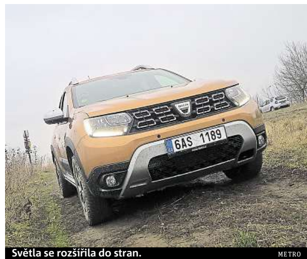
Světla se rozšířila do stran.

Zapomeňte na malinké Suzuki Jimny nebo těžce dostupnou Ladu Nivu. Pokud vezme cenu dusteru s pohonem všech kol (358 tisíc), těžko hledá v terénu konkurenci. Na levné SUV má skvělou křížitelnost náprav, příznivé nájezdové úhly i světlou výšku. HOPE