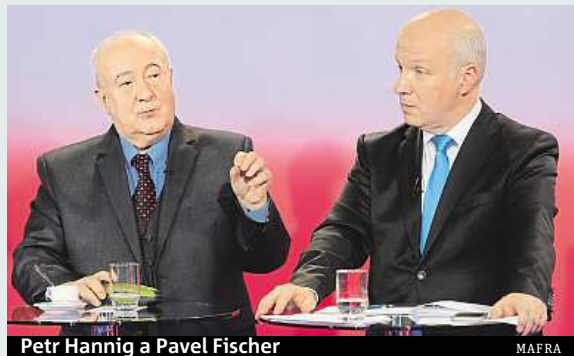
Petr Hannig a Pavel Fischer