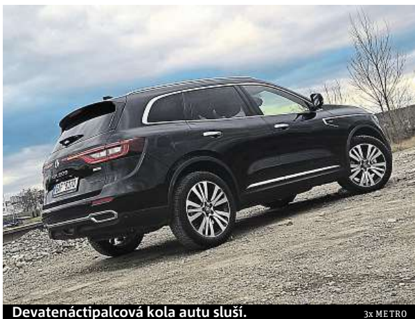
Devatenáctipalcová kola autu sluší.