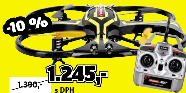
Kvadroptéra Carrera RC CRC X1, RtR, od 8 let Obj. č.: 1371971

Měří srdeční tep, časy kol, kalorie, vzdálenost, cílové zóny, rychlost, dobu trvání a čas. Svě výsledky lze vyhodnocovat po připojení k PC. Vě. hrudního pásu.