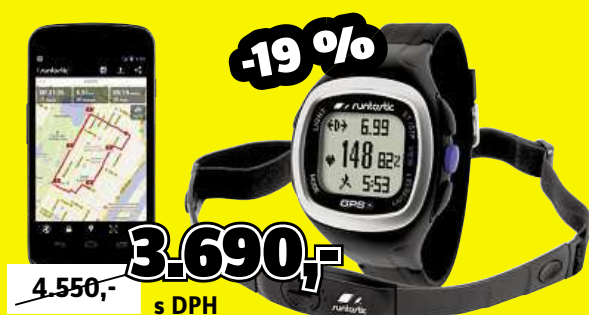
Sportovní hodinky s měřením pulzu a GPS Runtastic Obj. č.: 515158

Měří srdeční tep, časy kol, kalorie, vzdálenost, cílové zóny, rychlost, dobu trvání a čas. Svě výsledky lze vyhodnocovat po připojení k PC. Vě. hrudního pásu.