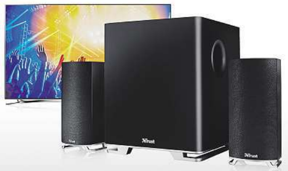
K regulaci hlasitosti lze použít i ovladač televize. MIRONET

Do všech našich požadavků se trefil Trust s jeho reproduktory Mitho v konfiguraci 2.1, tedy jedním subwooferem a dvěma takzvanými satelity. Výborná zvuková kvalita je dána mimo jiné i efektivním výkonem 60 wattů (maxi-