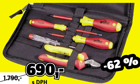
Sdílná profi sada VDE nářadí v praktické tašce Wiha Obj. č.: 1399828

Kvalitní topení s integrovaným časovačem na 60 minut, ochranou proti mrazu a přehřátí. 2 výkonové stupně 1 000 / 2 000 W. Odolné vůči kapající vodě. Pro místnosti do 20 m 2 .