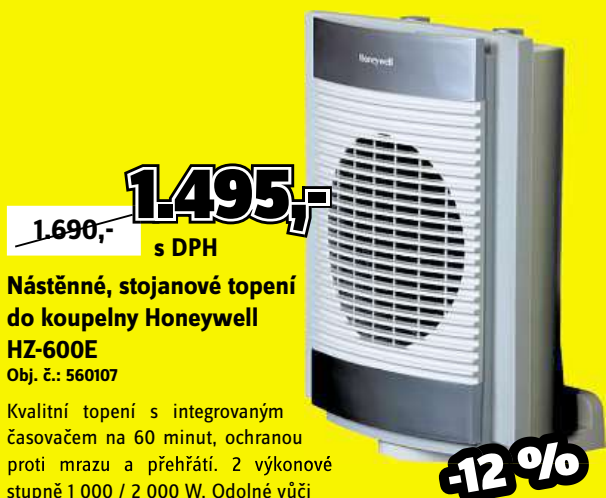
Nástěnné, stojanové topení do koupelny Honeywell HZ-600E Obj. č.: 560107

Jednoduché a stabilní letové vlastnosti, akrobatická funkce 3D LOOP. Bližší LED osvětlení. Doba letu až 7 minut. Doba nabíjení jen 60 min. Vě. dálkového ovládní a baterií. Šířka 174 mm.