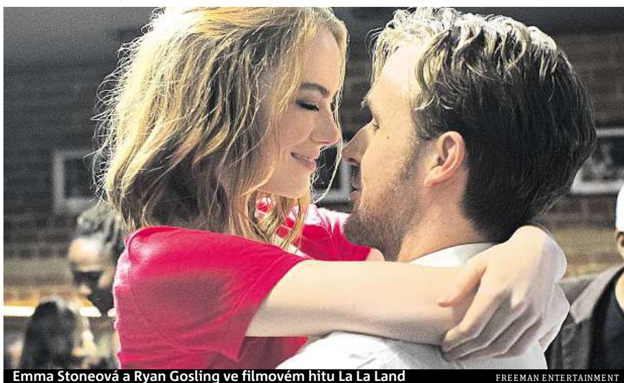
Emma Stoneová a Ryan Gosling ve filmovém hitu La La Land

Kritiky vysoce hodnocený snímek vypráví příběh lásky