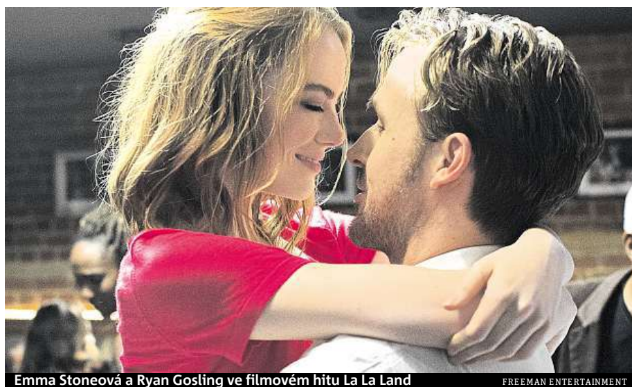
Emma Stoneová a Ryan Gosling ve filmovém hitu La La Land

Kritiky vysoce hodnocený snímek vypráví příběh lásky