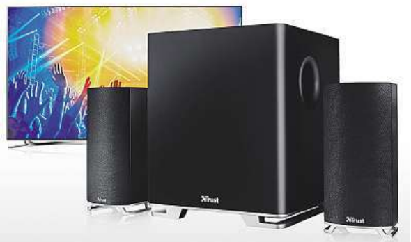
K regulaci hlasitosti lze použít i ovladač televize. MIRONET

Do všech našich požadavků se trefil Trust s jeho reproduktory Mitho v konfiguraci 2.1, tedy jedním subwooferem a dvěma takzvanými satelity. Výborná zvuková kvalita je dána mimo jiné i efektivním výkonem 60 wattů (maxi-