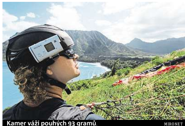
Kameru váží pouhých 93 gramů. MIRONET

Díky drobným rozměrům a nízké hmotnosti 93 gramů včetně baterie o ní nebudete během celé akce vůbec vědět. HDR-AS200VR se chlubí 8,8Mpx snímačem schopným zaznamenat ostré a detailní záběry ve full HD rozlišení. K výsledné kvalitě videa přispívá i širokoúhlý objektiv ZEISS Tessar s pokrytím 170° zorného pole a možností přepnout na rozsah 120° doplněný o op-