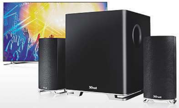
K regulaci hlasitosti lze použít i ovladač televize. MIRONET

Do všech našich požadavků se trefil Trust s jeho reproduktory Mitho v konfiguraci 2.1, tedy jedním subwooferem a dvěma takzvanými satelity. Výborná zvuková kvalita je dána mimo jiné i efektivním výkonem 60 wattů (maxi-