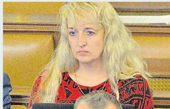
Nytrová ve Sněmovně

Sněmovna přehlasovala veto prezidenta Miloše Zemana a prosadila novelu zákona o dani z přidané hodnoty, která od letošního roku přerazuje noviny a časopisy do deseti procentní sazby DPH. Má to podle předkladatelů podpořit jejich prodej. Nyní jsou v sazbě 15 procent. Změna zákona vstoupí v účinnost 15. dnem po vyhlášení ve sbírce. ČTK