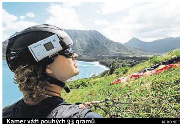
Kameru váží pouhých 93 gramů. MIRONET

Díky drobným rozměrům a nízké hmotnosti 93 gramů včetně baterie o ní nebudete během celé akce vůbec vědět. HDR-AS200VR se chlubí 8,8Mpx snímačem schopným zaznamenat ostré a detailní záběry ve full HD rozlišení. K výsledné kvalitě videa přispívá i širokoúhlý objektiv ZEISS Tessar s pokrytím 170° zorného pole a možností přepnout na rozsah 120° doplněný o op-