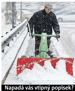
Napadá vás vtipný popisec?

Napište bublinu a reagujte na sloupek na: www.facebook.com/denikmetro