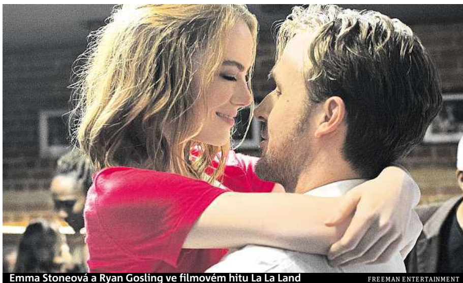
Emma Stoneová a Ryan Gosling ve filmovém hitu La La Land

Kritiky vysoce hodnocený snímek vypráví příběh lásky