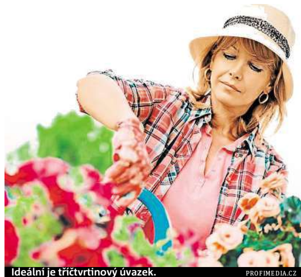
Ideální je třičtvrtinový úvazek.

Lidé starší čtyřiceti let jsou v takové fázi života, kdy se často musí starat o malé děti nebo o staré rodiče. To jim do dává sociální roli a účinky intenzivní práce na jejich mozek jsou komplexnější. V souvislosti se zvyšujícím se věkem se tři dny práce do týdne zdají být produktivnější volbou pro ty, kteří překročili čtyřicítku. ČTK