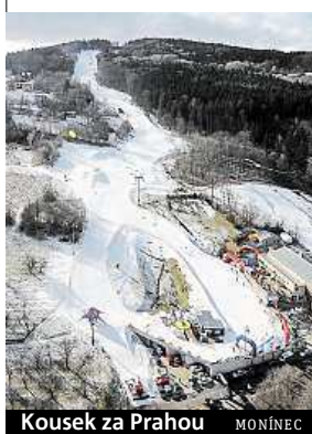
Kousek za Prahou MONÍNEC