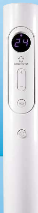
Renkforce PF5615, 1000/1500 W Obj. č.: 1308749