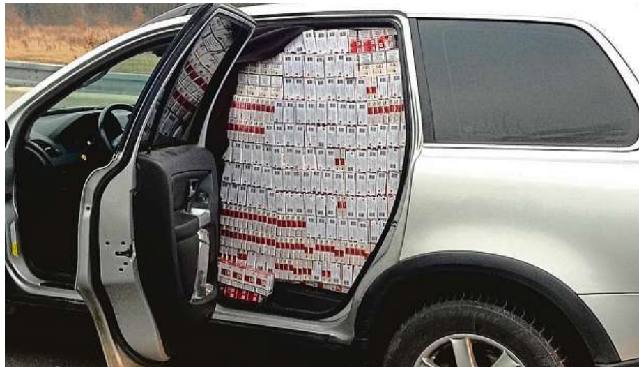
Pašované, pravé i padělané, cigarety se dostávají do Česka nejrůznějšími kanály. Jejich prodej ukrájí z daňových příjmů státu nezanedbatelnou část.