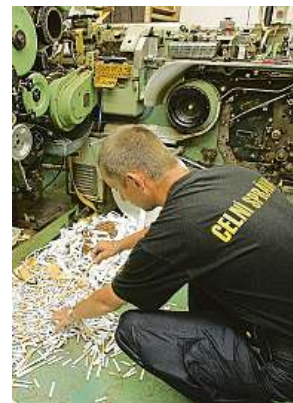
Celníci zasahují v jedné z nelegálních výroben cigaret.

Zkušenosti s takovou kriminalitou má například i Slovensko, kde jeden z útočníků na redakci časopisu Charlie Hebdo nakoupil zbraně k provedení teroristického útoku a podle francouzské policie nákup financoval právě i prodejem padělaných či pašovaných cigaret v Paříži.