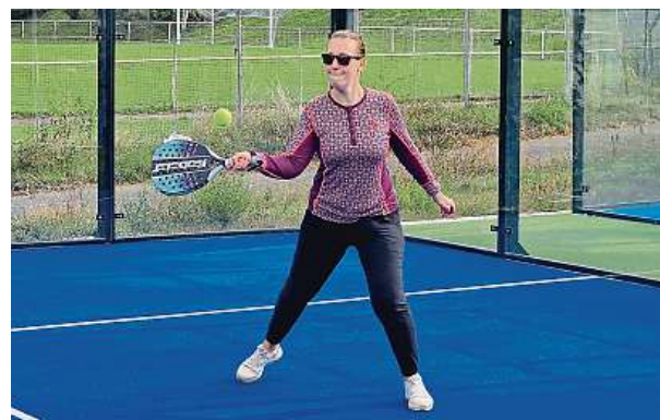
Hráči mohou zahrát míč jako „volej“ před dopadem míče na povrch kurtu. Zábavné je ale využívat ve hře „zrádné“ stěny.