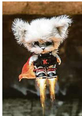
Hlavní hrdina cinemagrafové pohádky pro děti se jmenuje KIDÓ. MATĚJ DERECK HARD

Ten malý plyšák vládne superschopností vniknout komukoli jakoukoli myšlenkou... Myslím, že to byla jistá forma arteterapie. Musím se přiznat, že pocit, co těm zlým uzurpátorům mohu v příběhu provést, byl celkem příjemný. Takže jsem třeba prostřednictvím postavy KIDÓ. jednoho z fiktivních násilníků poslal na lekce baletu.