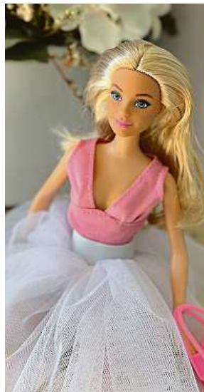
Projekt vznikl nedávno.

by generovalo profit. Veškeré příjmy jsou opět investovány zpět, aby projekt dostal svého potenciálu. Naopak ta investice, kterou jsem v průběhu příprav udělala, byla celkem značná. Každá panenka má na sobě opravdu malou marži. Po odečtení ceny panenky, ceny práce, oblečku a ostatních úprav je konečný profit jen tak velký, aby pokrýval provozní náklady.