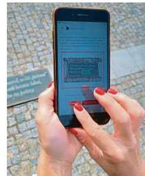
S trasou je spojeno i plnění úkolů.