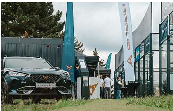
Tuzemské zastoupení značky aut Cupra je hlavním partnerem České padelové federace. V Edenu ukázala Formentor Tribe Edition.