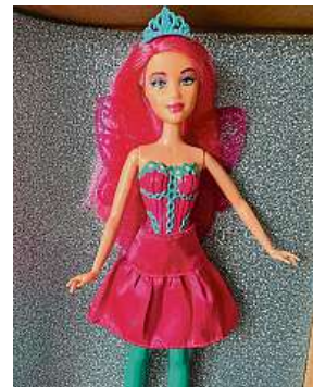
Výsledek po opravě na prodej