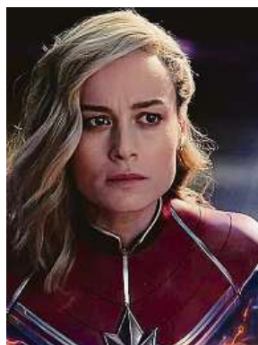
Film pojednává o několika „marvelkách“. FALCON

Rozpočet filmu se mimo jiné i kvůli dotáčkám vyšplhal na 270 milionů dolarů. O drahém marketingu, který mohl studio klidně vyjít na další stovku, nemluvě. Disney se snažil dříve tvrdit, že byl snímek o sto milionů levnější. Kvůli úniku informací je však