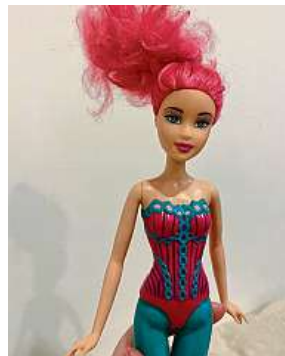
Panenka před opravou 3x E. H.

Cenu panenky zvedat neplánujeme, ale věřím, že s větším odbytem kusů se sníží