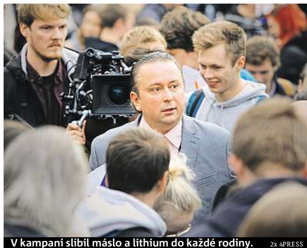
V kampani slíbil máslo a lithium do každé rodiny. 2x 4PRESS