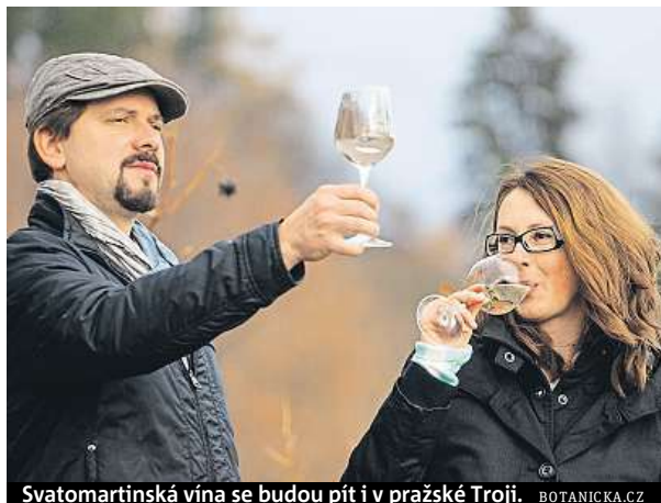
Svatomartinská vína se budou pít i v pražské Troji.