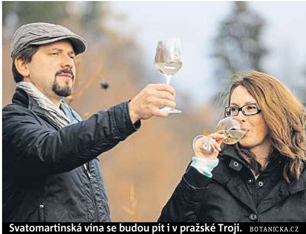
Svatomartinská vína se budou pít i v pražské Troji.