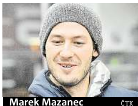
Marek Mazanec ČTK

Čeští hokejisté budou dnes proti Švýcarsku usilovat o nápravu úvodní porážky se Švédy.