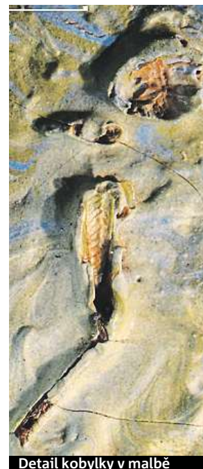
Detail kobylky v malbě

jak se na Van Gogha podívat z nového úhlu pohledu.“