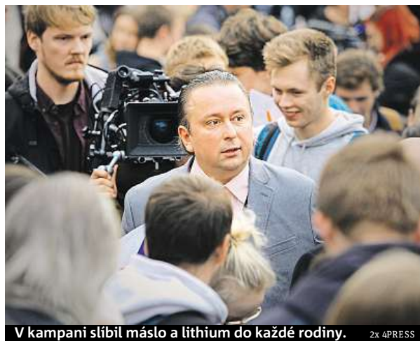
V kampani slíbil máslo a lithium do každé rodiny.