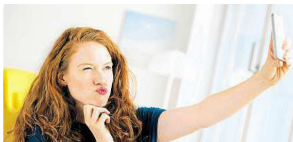
Sarah likes her flat, but her landlord is a problem.