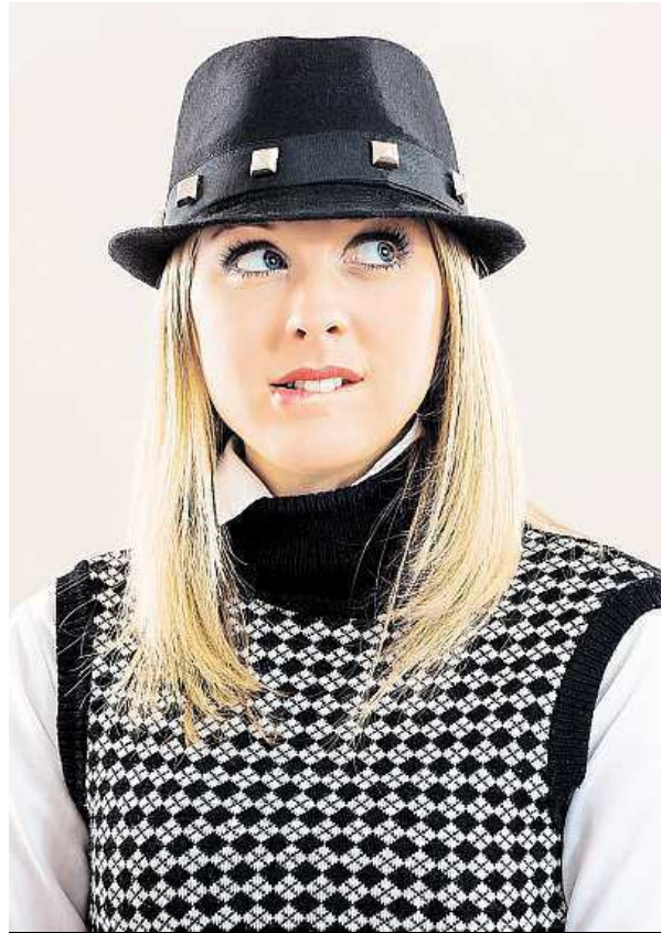
Magda is worried about her first day in her new job.