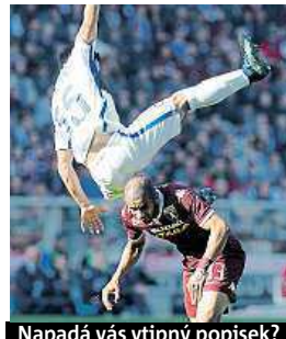
Napadá vás vtipný popisec?

Napište bublinu a reagujte na sloupek na: www.facebook.com/denikmetro