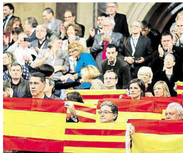
Při hlasování drželi někteří poslanci katalánské vlajky.