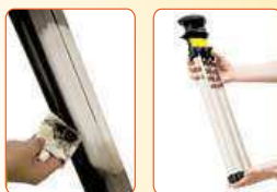
Filtry není třeba nikdy vyměňovat! Stačí je jen občas jednoduše vyjmout a otřít. Účinek filtrace ihned vidíte!

Až 70 % Čechů dýchá škodlivý vzduch! Od roku 2006 zemřelo kvůli znečištěnému ovzduší bezmála 34 tisíc Čechů a další tisíce lidí se musely léčit v nemocnicích. Vysoké koncentrace polévatého prachu, chemikálií a jiných nečistot vážně ohrožují naše zdraví. Hygienici v těchto dnech bijí na poplach a doporučují nevětrat. Je ale prostředí v uzavřené místnosti skutečně zdravější než to venkovní?