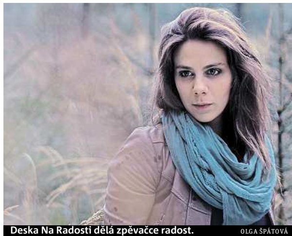
Deska Na Radosti dělá zpěvačce radost.

Kluci se mi ozvali sami. Poslali mi demo písničky Sen