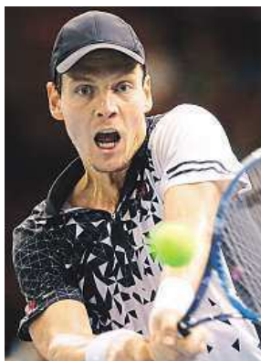
Sedmý hráč světa