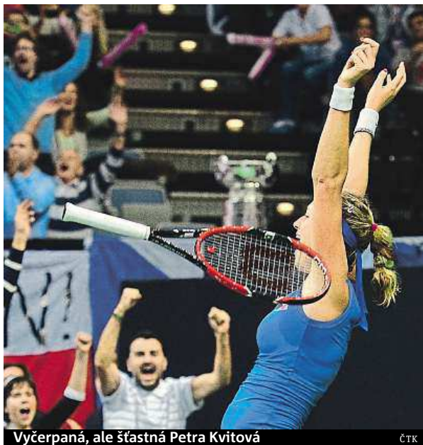
Vyčerpaná, ale šťastná Petra Kvitová

s Kerberovou mě stál hodně sil, byl opravdu super. Hrály jsme výborný tenis, byl to boj o každý míč. Je to speciální a děkuji fanouškům,“ řekla vítězka Wimbledonu.