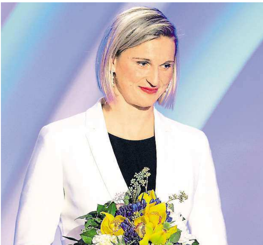
Barbora Špotáková Atletu roku vyhrála, za ni skončili Vítězslav Veselý a Pavel Maslák.

V tomhle věku jediné zranění. To se občas bohužel stává, napadá to člověka denno-