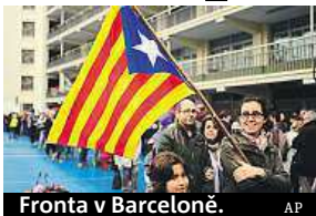
Fronta v Barceloně.

V Katalánsku se včera uskutečnilo zakázané referendum o nezávislosti této autonomní oblasti Španělska. Hlasování pozastavil Ústavní soud, chce teprve rozhodnout, zda je legální. Důležitá pro zastánce katalánské nezávislosti je účast voličů, podle nejoptimističtějších odhadů