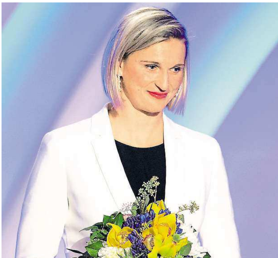
Barbora Špotáková Atletu roku vyhrála, za ni skončili Vítězslav Veselý a Pavel Maslák.

V tomhle věku jediné zranění. To se občas bohužel stává, napadá to člověka denno-