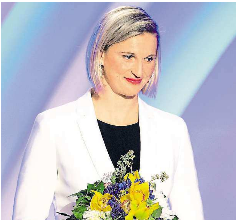
Barbora Špotáková Atletu roku vyhrála, za ní skončili Vítězslav Veselý a Pavel Maslák.

V tomhle věku jediné zranění. To se občas bohužel stává, napadá to člověka denno-