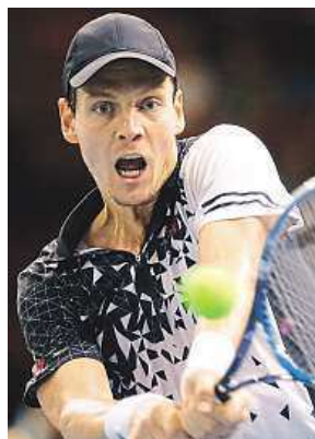
Sedmý hráč světa