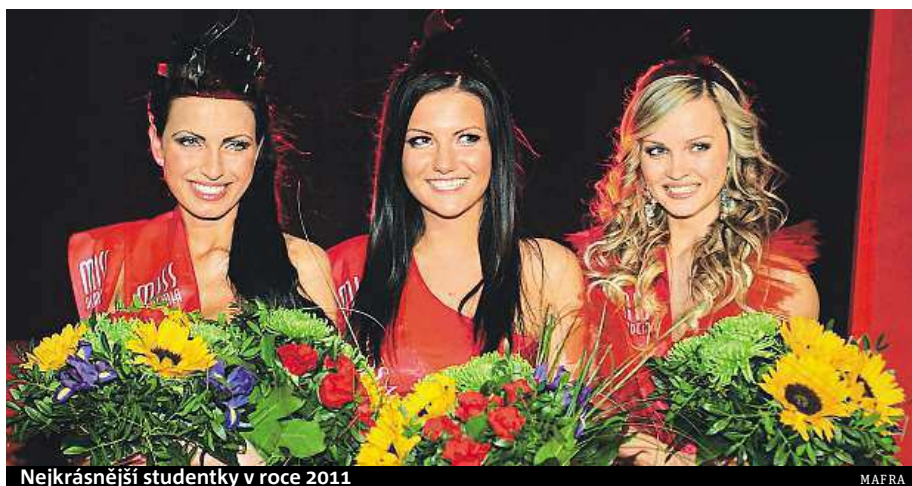
Nejkrásnější studentky v roce 2011

Letošní ročník soutěže doprovází kampaň, která se snaží zvýšit sebevědomí studentek – byla nazvána Nepochybuj o své kráse. Do loňského ročníku se přihlásilo téměř 700 dívek. V nadcházejícím týdnu pořadatelé vyrazí na cestu po pěti městech, kromě Zlína navštíví Brno, Prahu, Ostravu a Olomouc. „Zájemci se