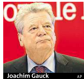
Joachim Gauck

S vývojem Německa po roce 1989 nejsou spokojeni ti lidé, které zasáhl nepříznivý vývoj po hospodářském kolapsu někdejší Německé demokratické republiky. Politické cíle, za které bojovali aktivisté, když strhli Berlínskou zeď, se však podařilo naplnit. Řekl to německý prezident Joachim Gauck. ČTK