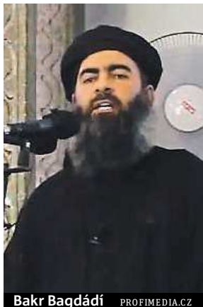
Bakr Bagdádí

Podle stanice Al-Arabija byl při náletu na kolonu kriticky zraněn vůdce Islámského státu (IS) Abú Bakr Bagdádí.