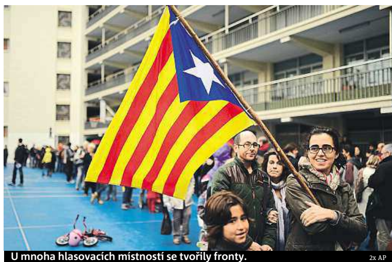
U mnoha hlasovacích místností se tvořily fronty.

V Katalánsku se včera uskutečnilo zakázané referendum o nezávislosti této autonomní oblasti Španělska. Hlasování pozastavil Ústavní soud, chce teprve zhodnotit, zda je legální. Důležitá pro zastánce katalánské nezávislosti je účast voličů, podle nejoptimističtějších odhadů však přišly hlasovat z pěti milionů jen dva, i když volit mohli i šestnáctiletí. Výsledky budou známy až dnes.