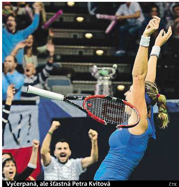
Vyčerpaná, ale šťastná Petra Kvitová

s Kerberovou mě stál hodně sil, byl opravdu super. Hrály jsme výborný tenis, byl to boj o každý míč. Je to speciální a děkuji fanouškům,“ řekla vítězka Wimbledonu. RB