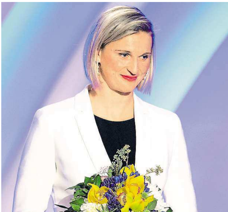
Barbora Špotáková Atletu roku vyhrála, za ni skončili Vítězslav Veselý a Pavel Maslák.

V tomhle věku jediné zranění. To se občas bohužel stává, napadá to člověka denno-