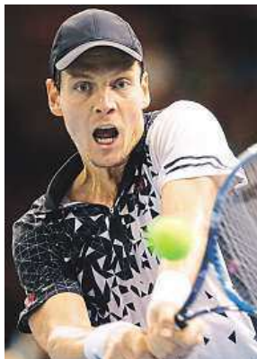
Sedmý hráč světa