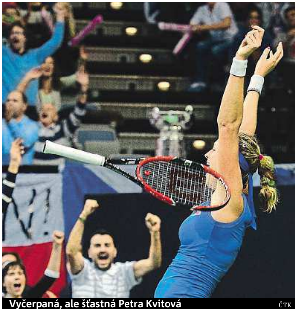
Vyčerpaná, ale šťastná Petra Kvitová

s Kerberovou mě stál hodně sil, byl opravdu super. Hrály jsme výborný tenis, byl to boj o každý míč. Je to speciální a děkuji fanouškům,“ řekla vítězka Wimbledonu. RB