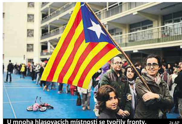
U mnoha hlasovacích místností se tvořily fronty.

V Gironě se několik lidí pokusilo narušit hlasování v jedné ze škol. Útočili na voliče a pokoušeli se zničit urny. Policisté je nakrátko zadrželi a pak propustili na svobodu s tím, že o jejich dalším osudu později rozhodne soudce. Jsou obviněni z násilnosti a rušení veřejného klidu. Akci podle agentury RIA Novosti monitoruje osm poslanců z Belgie, Francie, Slovinska, Švédska a Británie.