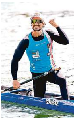
Fuksa se raduje z titulu mistra světa.

My trénujeme od října do srpna, průměrně šestkrát v týdnu. Jsou týdny, kdy trénuje-