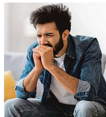
Podle statistik má s duševní chorobou zkušenost každý pátý člověk.

Duševní porucha může postihnout kohokoliv, konkrétně deprese navíc provází celou řadu jiných onemocnění či postižení a ztěžuje tak rekonvalescenci. Mezi nejčastější patří mimo jiné neurozy, deprese, úzkosti, dále bipolární porucha, schizofrenie, poruchy osobnosti nebo užívání návy-