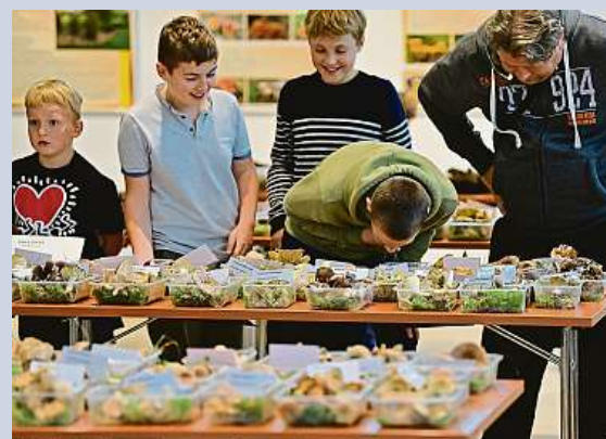
Výstava hub v Jihočeském muzeu