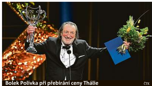
Bolek Polívka při přebírání ceny Thálie