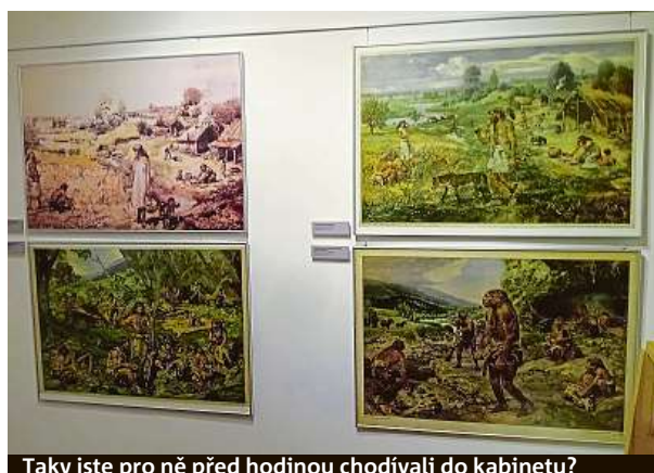
Taky jste pro ně před hodinou chodili do kabinetu?