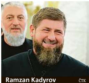
Ramzan Kadyrov

Někteří ambiciózní představitelé ruského vedení ve vzniklém chaosu zavětřili příležitost a Kremlu předložili návrhy, jak zvrátit neúspěš-