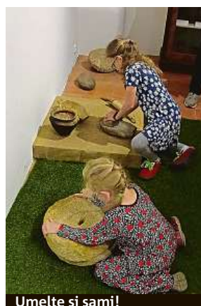
Umele si sami!