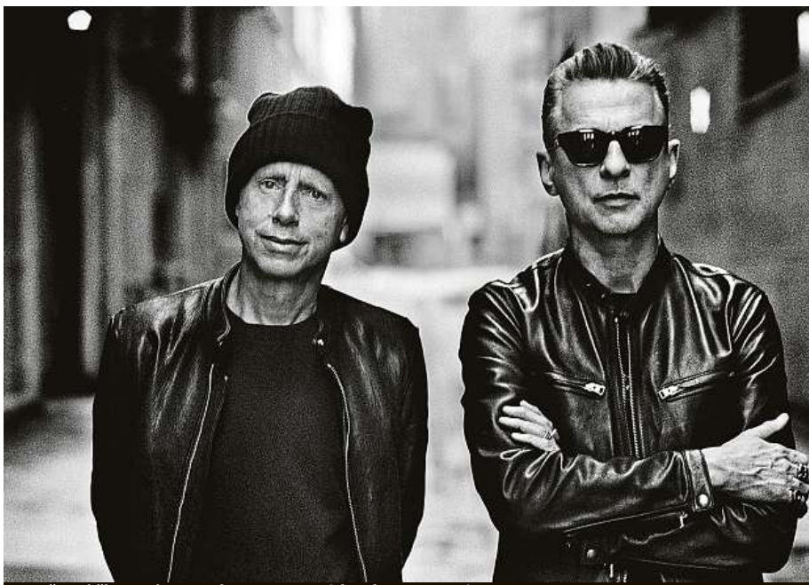
Současní členové Depeche Mode David Gahan a Martin Gore

Aby radosti nebylo málo, 30. července 2023 se dočkají i čeští fanoušci a nestárnoucí hity i novinky „Depešáků“ se rozezní i letiště Letňany v Praze. Kromě toho zahrají současní členové kapely Martin