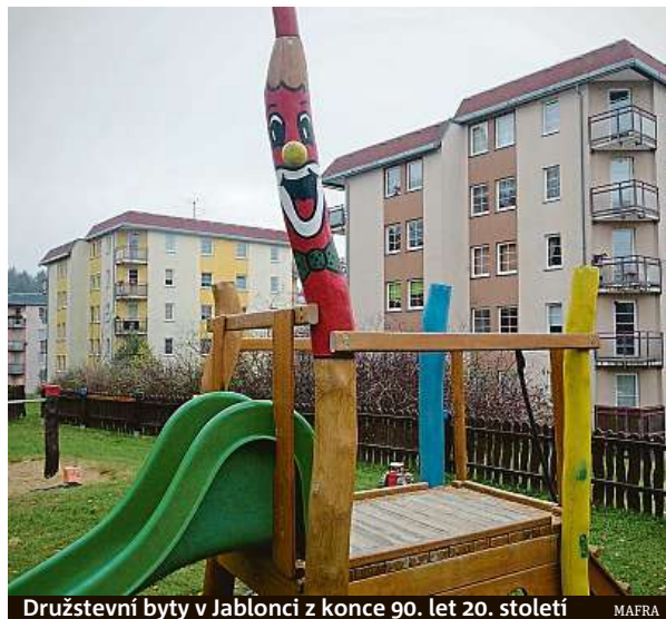
Družstevní byty v Jablonci z konce 90. let 20. století

Při nákupu družstevního podílu stačí mít k dispozici asi pětinu až třetinu hodnoty