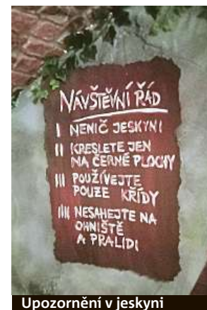
Upozornění v jeskyni