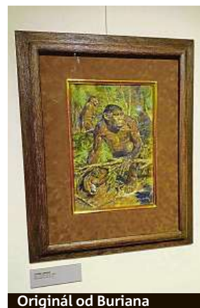
Originál od Buriana