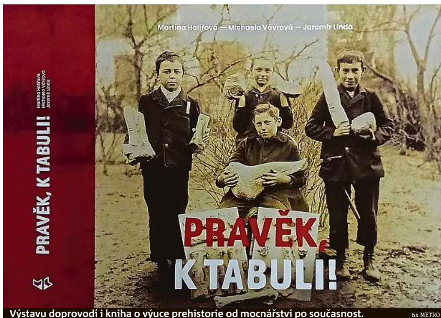
Výstavu doprovodí i kniha o výuce prehistorie od mocnářství po současnost.

Pedagogickému muzeu se podařilo shromáždit exponáty, z nichž některé veřejnost uvidí úplně poprvé. Týká se to například archeologických nálezů, rukopisů a dalších věcí ze sbírek Eduarda Štorcha, spisovatele a také amatérského archeologa. Kdo by