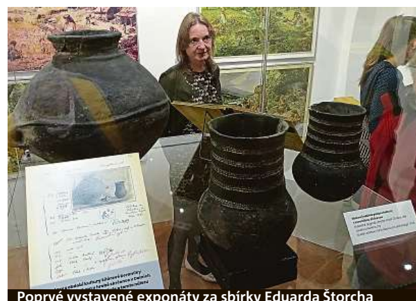
Poprvé vystavené exponáty za sbírky Eduarda Štorcha