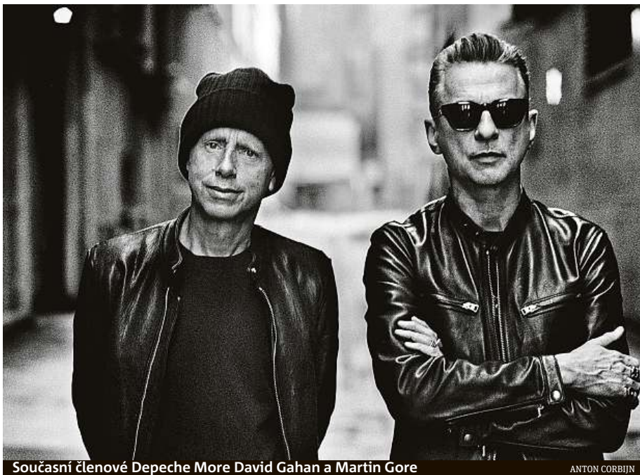
Současní členové Depeche Mode David Gahan a Martin Gore

Aby radosti nebylo málo, 30. července 2023 se dočkají i čeští fanoušci a nestárnoucí hity i novinky „Depešáků“ se rozezní i letiště Letňany v Praze. Kromě toho zahrají současní členové kapely Martin