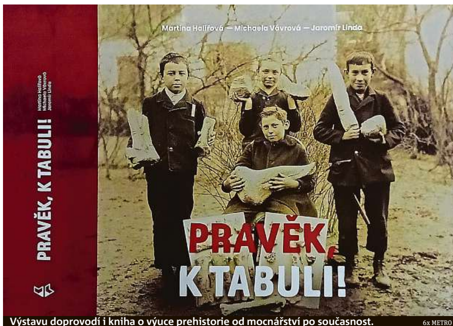
Výstavu doprovodí i kniha o výuce prehistorie od mocnářství po současnost.

Pedagogickému muzeu se podařilo shromáždit exponáty, z nichž některé veřejnost uvidí úplně poprvé. Týká se to například archeologických nálezů, rukopisů a dalších věcí ze sbírek Eduarda Štorcha, spisovatele a také amatérského archeologa. Kdo by