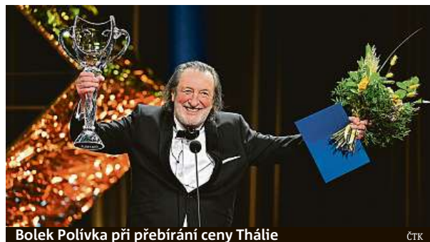
Bolek Polívka při přebírání ceny Thálie