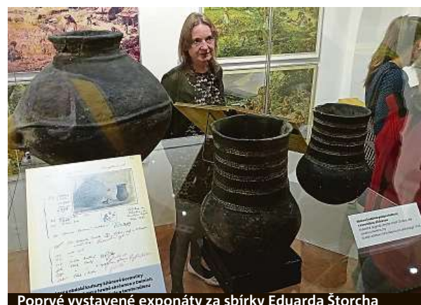
Poprvé vystavené exponáty za sbírek Eduarda Štorcha