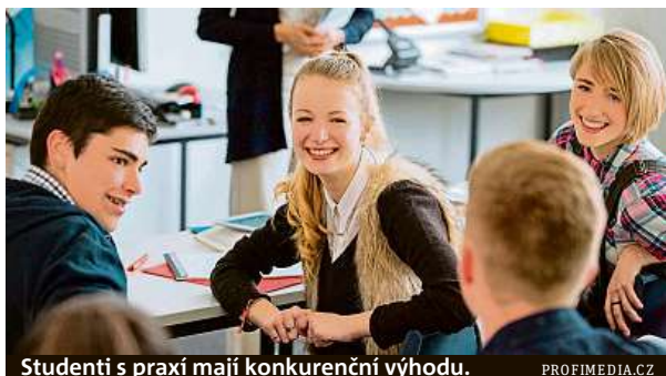
Studenti s praxí mají konkurenční výhodu.

„Na současných zakázkách pracuje pět studentů napříč všemi ročníky a několik našich absolventů. Studenty i absolventy zapojujeme do zakázek na tvorbu webů, aplikací a programování. Podle své pokročilosti se věnují činnostem od naplňování dat až po složitější kódování. Hodinová sazba se odvíjí od schopností brigádníka a vzhledem k oboru jde o nadprůměrné ohodnocení,“ uzavřel ředitel Vodička. MET