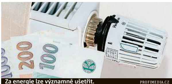
Za energie lze významně ušetřit.

Nárůstu cen lze předcházet i tím, že si doma zkontrolujeme, zda neplatíme více, než musíme. Jestliže využíváte elektřinu i pro vytápění, je důležité, abyste si zkontrolovali distribuční sazbu. A to nejen v domě či bytě, ale také na chatách a chalupách. Máte-li například tepelné čerpadlo nebo elektrický bojler, měli byste mít nastavenou dvoutarifní sazbu, tedy vysoký a nízký tarif, kterému se dříve také říkalo noční proud. Pro někoho je to samozřejmost, ale v mnoha případech se tak neděje. Lidé si mění systém