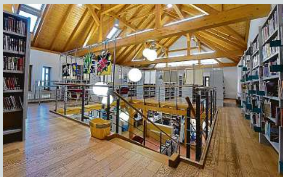
Místní knihovna Pavla Křížkovského v Holasovicích ČTK

kou Pálinkovou je pověřena výkonem regionálních funkcí pro 22 neprofesionálních knihoven v regionu. Knihovna cenu dostala za spolupráci s vedením obce, kvalitu knihovního fondu a profesionální práci knihovníků. Součástí včerejšího předávání bylo též ocenění Městská knihovna roku, kterou vyhlašuje Svaz knihovníků a informačních pracovníků. Ocenění získala Regionální knihovna Karviná, a to za moderní prostředí a propagaci čtenářů a čtenářství. ČTK