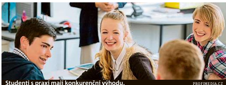
Studenti s praxí mají konkurenční výhodu.

Zapojení studentů do hospodářské činnosti středních odborných škol se vyplácí.