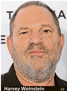
Harvey Weinstein

Podle nedělního oznámení společnosti byl s okamžitou platností vyhozen. Jeden z nejmocnějších mužů Hollywoodu podle médií ženy sexuálně obtěžoval dlouhodobě. „Ve světle nových infor-