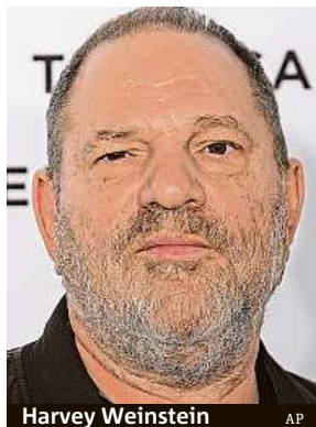
Harvey Weinstein

Podle nedělního oznámení společnosti byl s okamžitou platností vyhozen. Jeden z nejmocnějších mužů Hollywoodu podle médií ženy sexuálně obtěžoval dlouhodobě. „Ve světle nových infor-