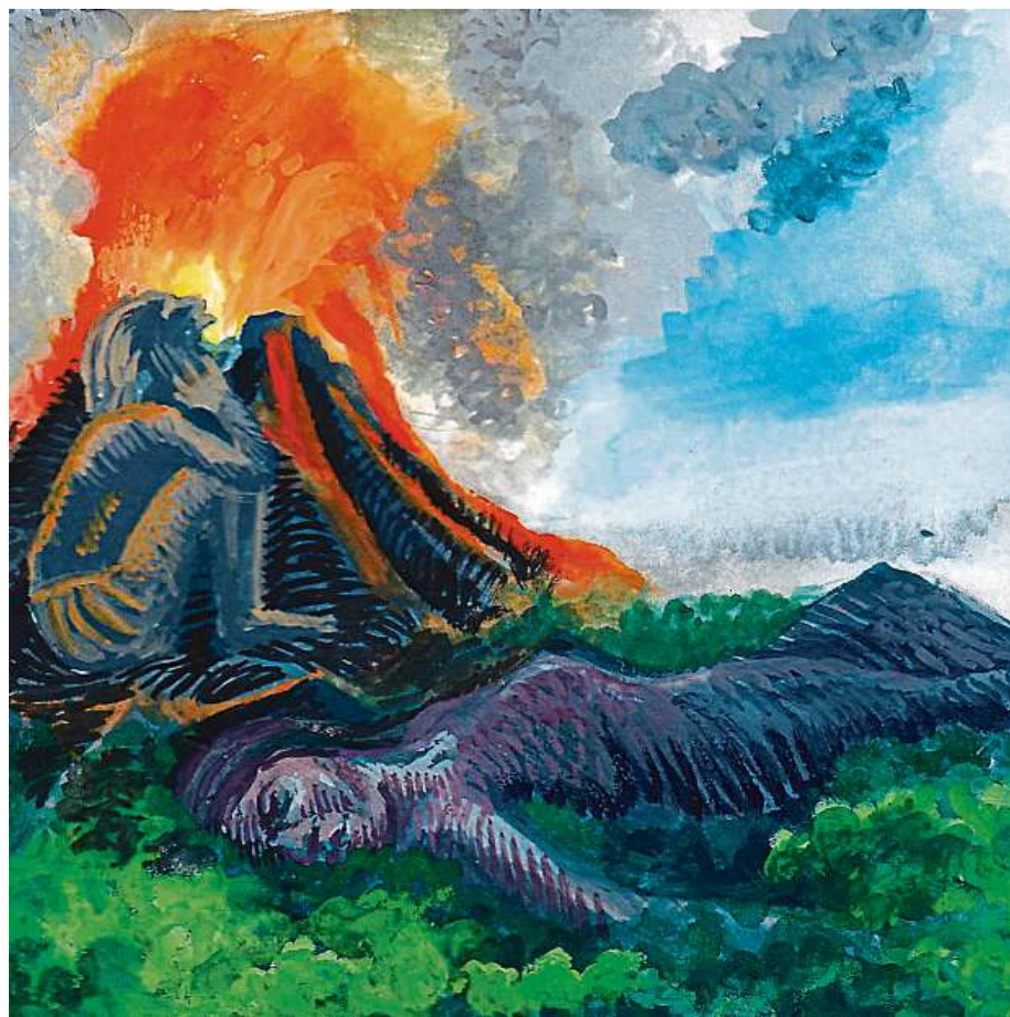
Myths and legends – North America HANNAH EATON/BRITISH COUNCIL

honesty even in a difficult situation c. a group of people who are not your friends and who want to hurt you d. make someone feel extremely sad e. a mountain with a hole at the top that sometimes explodes and lets out very hot liquid rock and smoke