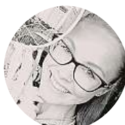
Alča Zvesmiruspadla Vyhazují zbytky po dětech ze země a talířů.