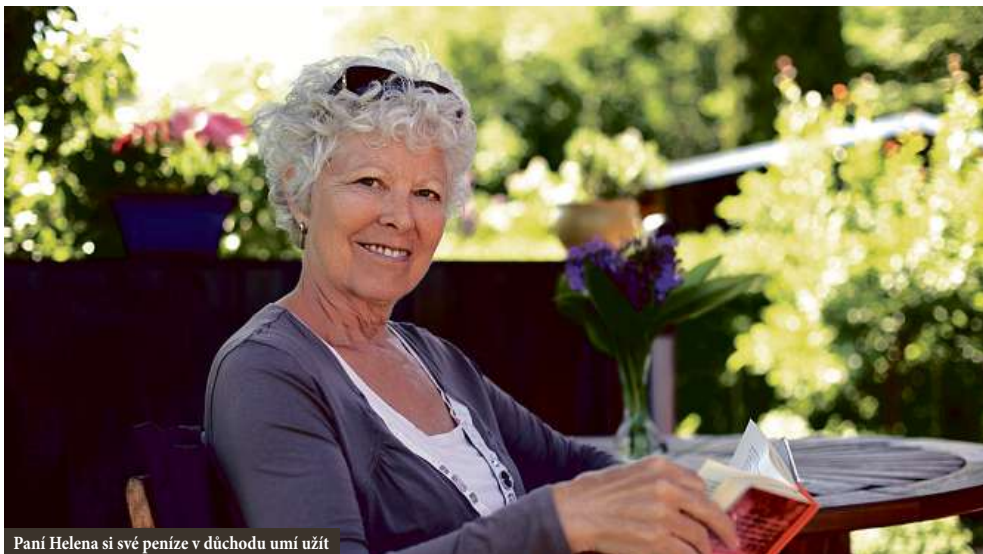
Paní Helena si své peníze v důchodu umí užít