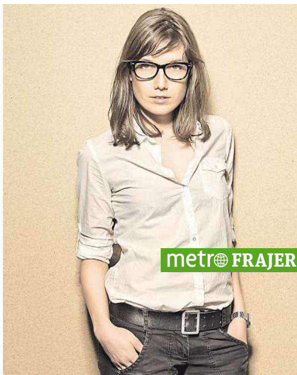
Nesnáší nakupování, ale oblečení si netiskne.