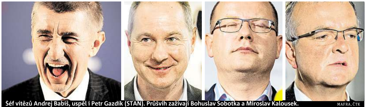
Šéf vítězů Andrej Babiš, uspěl i Petr Gazdík (STAN). Průšvihů zažívají Bohuslav Sobotka a Miroslav Kalousek.

Jasným vítězem voleb je hnutí ANO. Dokázalo převládat především sociální demokracie, se kterými jsou ve vládní koalici, a sebrat jim celkem devět krajů. Na druhou stranu to neznamená, že ANO bude mít zároveň i devět hejtmanů. Do regionálních zastupitelstev se dostalo