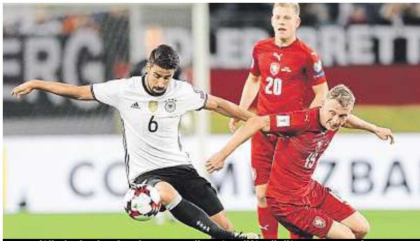
Tradiční obrázek zápasu. Němci měli většinou navrch.

Jasná výhra 3:0 se zrodila v sobotu večer v Hamburku mezi fotbalisty Německa a Česka.