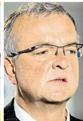
Šéf vítězů Andrej Babiš, uspěl i Petr Gazdík (STAN). Průšvihů zažívají Bohuslav Sobotka a Miroslav Kalousek.

nakonec povedou koalice, v nichž ANO být vůbec nemusí. Třeba v Královéhradeckém kraji se už na koalici bez ANO domlouvá pět jiných stran.