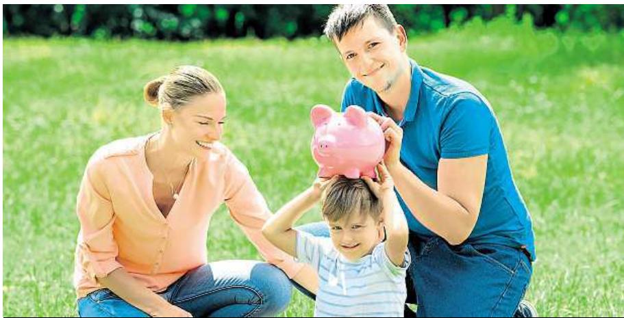
Spoření pro děti se vyplatí, odkládejte jim alespoň 300 korun pro budoucnost.

Odkládat peníze potomkům od malička je vítaná a využívaná novinka.