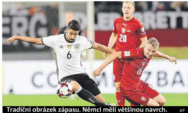
Tradiční obrázek zápasu. Němci měli většinou navrch.

Hlavní podíl na výhře Němců měl Thomas Müller, který dal dvě branky. Tu první ve 13. minutě, další přidal ve druhém poločasu, mezitím se chvíli po pauze prosadil Toni Kroos. Za hosty zahrozil dvakrát Dočkal, ale nejdříve míč vyrazil Neuer a pak putovala střela vedle. Gól Krejčího v nastavení neuznali rozhodčí pro údajný ofsajd.