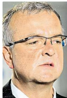
Šéf vítězů Andrej Babiš, uspěl i Petr Gazdík (STAN). Průšvihů zažívají Bohuslav Sobotka a Miroslav Kalousek.