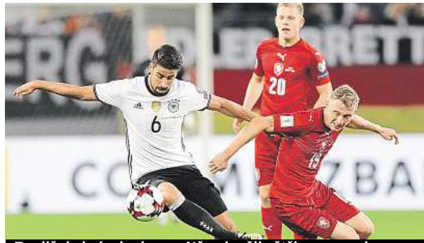
Tradiční obrázek zápasu. Němci měli většinou navrch.

Jasná výhra 3:0 se zrodila v sobotu večer v Hamburku mezi fotbalisty Německa a Česka.