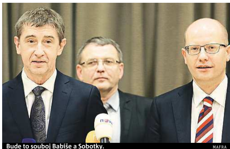
Bude to souboj Babiše a Sobotky.